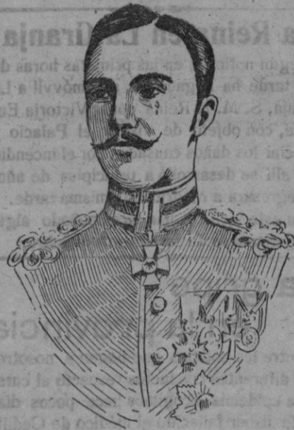
El príncipe Federico Carlos de Hesse mayor general prusiano, nombrado Rey de Finlandia