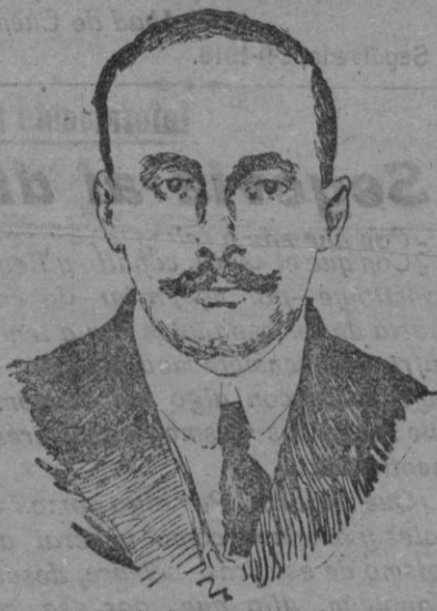
JUAN VENTOSA, primer ministro de Abastecimientos