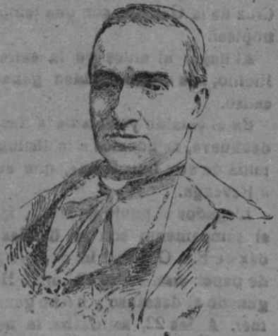
MONSEÑOR RINALDINI, ex-nuncio de S. S. en España, que se halla enfermo de gravedad.