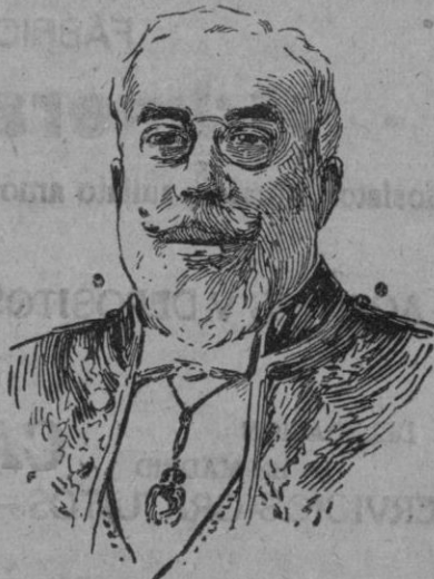
DON FRANCISCO COMMELERÁN nombrado senador por la Real Academia Española