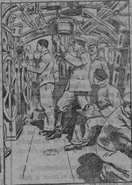
INTERIOR DE UN SUBMARINO