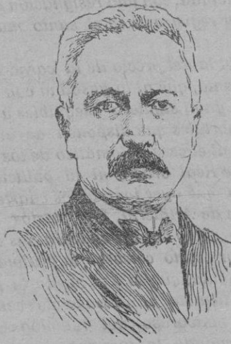
V. E. ORLANDO,

nuevo presidente del Consejo de ministros de Italia