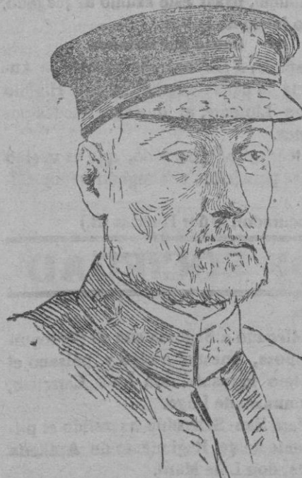
CONTRALMIRANTE SIMS, comandante de las fuerzas navales norteamericanas en aguas de Europa.