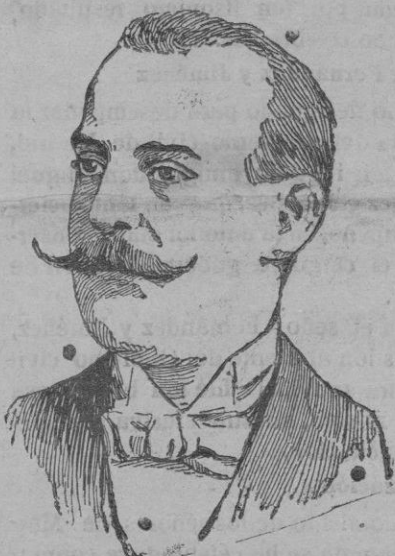
El ex-rey Constantino de Grecia

En el «Boletín oficial» de ayer se ordena a la Guardia civil, peones camineros y autoridades de los pueblos por donde han de pasar los corredores, tomen las medidas convenientes para evitar desgracias.