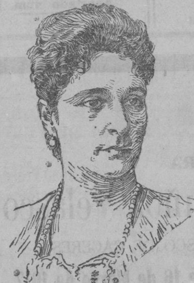
LA EXZARINA ALEJANDRA DE RUSIA

El Zar había partido de dicho Cuartel general para trasladarse a la capi-