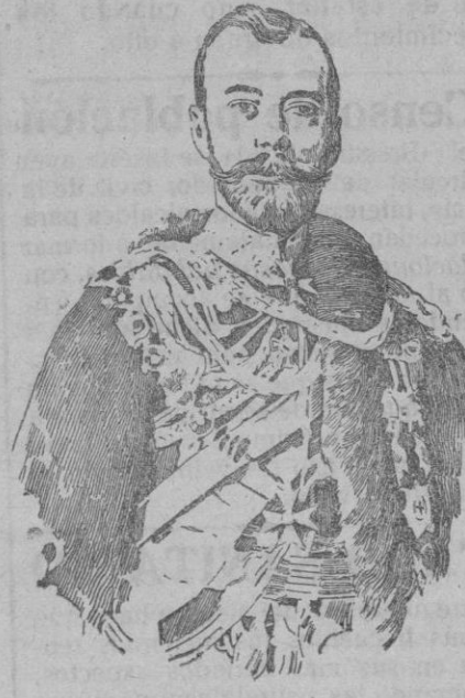
NICOLAS II DE RUSIA

Dicen de Milán que la policía rusa detuvo, entre otros, a siete miembros de la Duma.