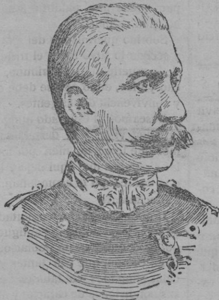
EL GENERAL LYAUTEY NUEVO MINISTRO DE LA GUERRA FRANCÉS