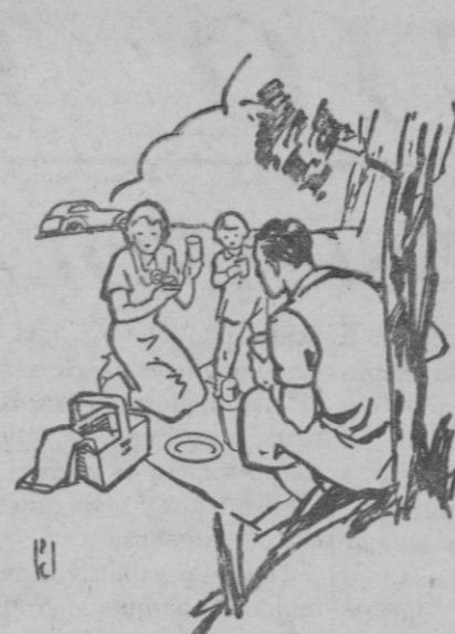
Para los señores a Sociedad Nestlé, (Sección LD22) Via Logroño, 47, Barcelona, en ejemplo gratis del delicioso leche condensado "Lechera".

Programa de los festejos que tendrán lugar en Buñola durante los días 20, 21, 22 y 23 del actual: