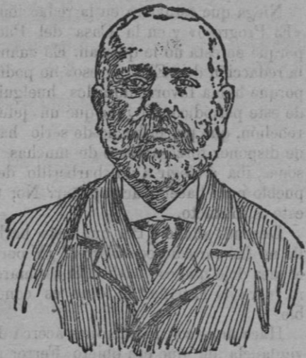
FRANCISCO FERRER GUARDIA