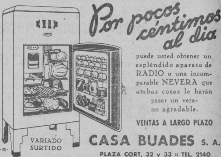
VARIADO SURTIDO CASA BUADES S. A. PLAZA CORT, 32 y 33 TEL. 2140