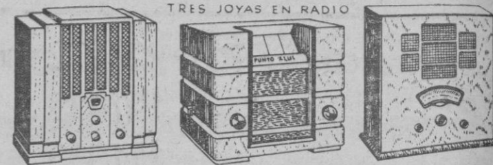
TRES JOYAS EN RADIO RADIO CROSLY PUNTO AZUL RADIONE

CÉSPEDES KID BORO BAILERA ALCALA VILANOVA YOUNG FRANCÉS OROZ ISASTI ARA MENDIETA ENTRADAS DESDE 1 PTAS.