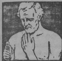
NO ES PRECISO FROTAR NI VENDAR