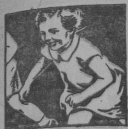
LO MEJOR PARA LAS CONTUSIONES