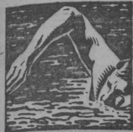
DESPUES DEL EJERCICIO REANIMA