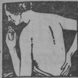
NO MANCHA NI IRRITA NUNCA