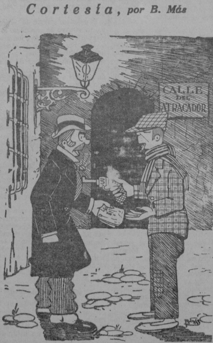
No tema Vd. caballero, yo no soy de estos groseros que todo lo hacen con violencia, haga el favor de darme por su propia voluntad todo el dinero que lleva.

Toda la correspondencia literaria y administrativa para EL DIA debe ser dirigida al apartado de Correos número 22