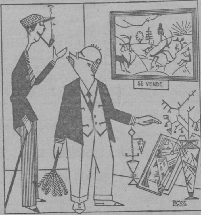
—Este cuadro debe ser de la época revolucionaria del arte? —Si señor, de la época del arte revolucionario, contemporáneo.