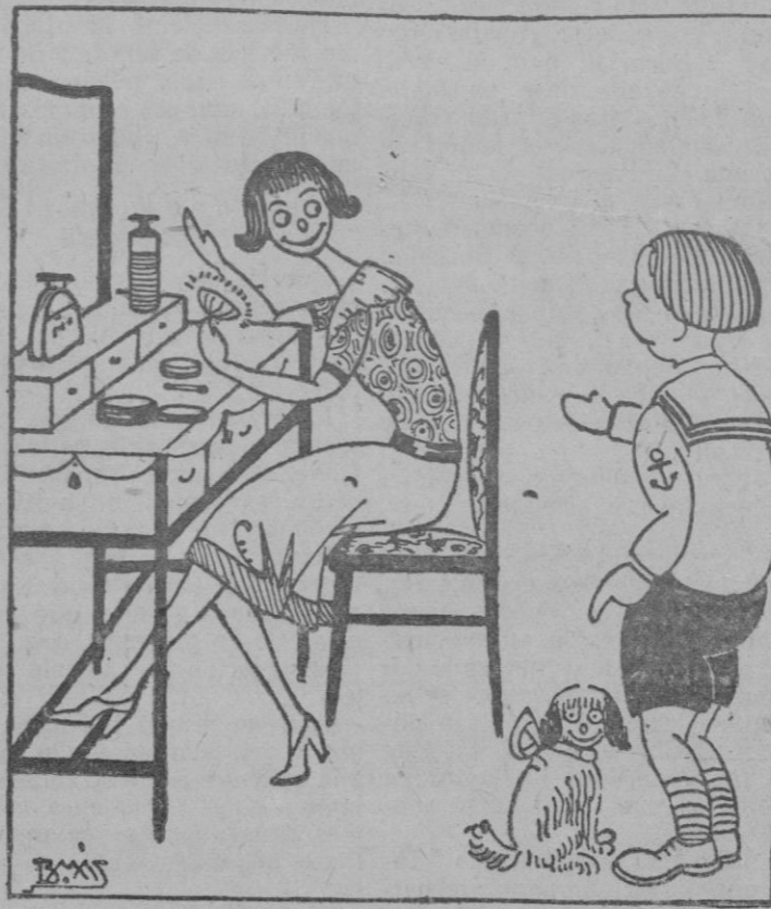
Dime; Antón, ¿Estoy guapa? Sí, muy mona, te pareces a Lulú.