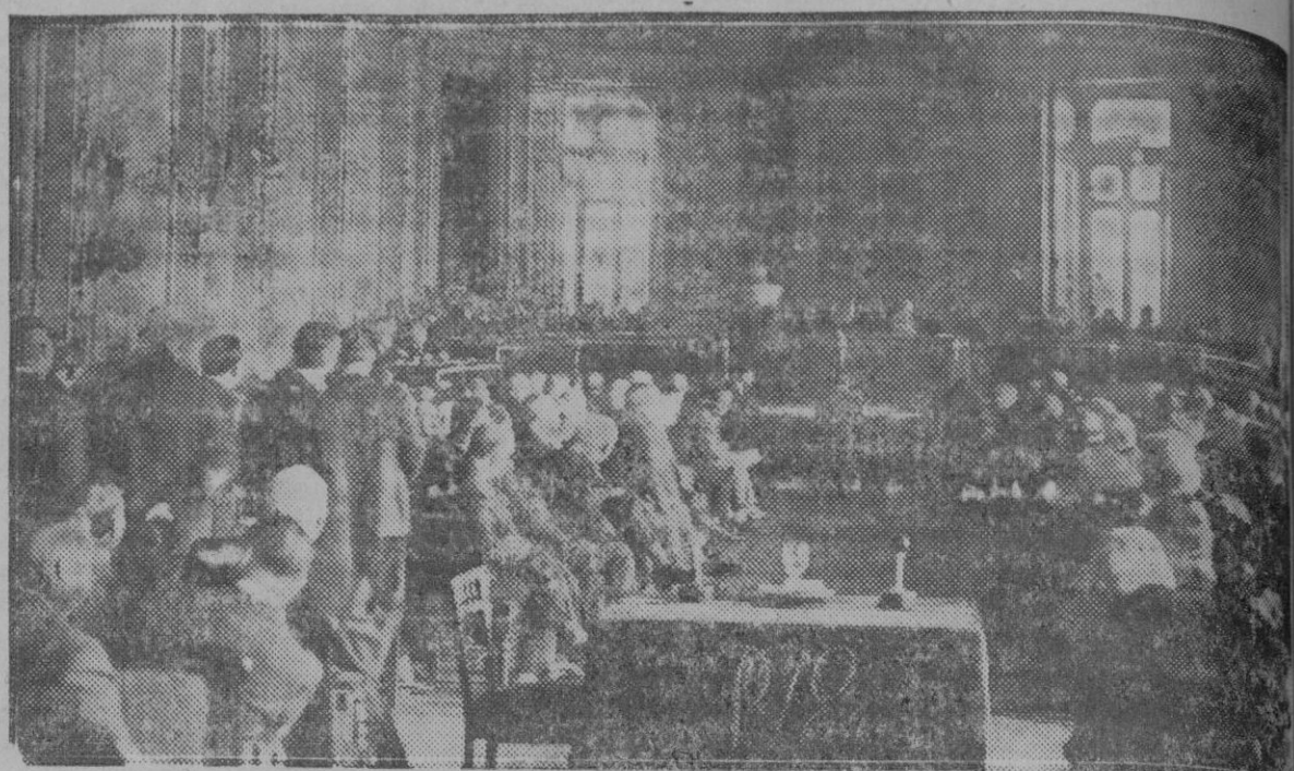
Aspecto del salón de Juntas durante la celebración de la extraordinaria de accionistas del Banco de España