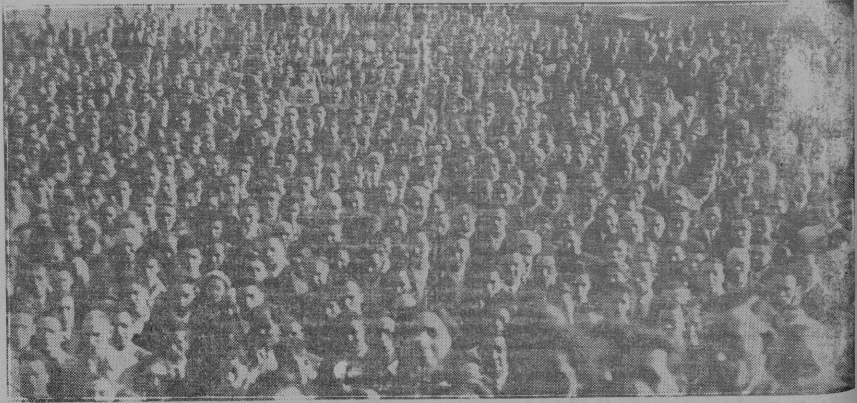
Un detalle de la concurrencia al mitin celebrado en Amorebieta en pro de la autonomía vasca, en el que todos los asistentes, descubiertos, entonaron el himno vasco