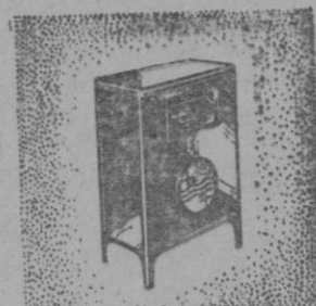
LA "CONSOLETTA" 2601