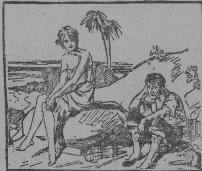
Ella (después del naufragio).—No se ponga tan triste, amigo. Ya vendrá algún vapor a recogerlos. El.—Por eso me pongo triste.