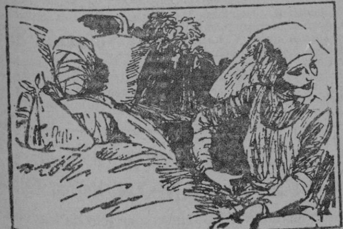
La linda enfermera.—Creo que debe estar mejor, doctor. Por lo menos se ha pasado la mañana haciéndome guiñadas.