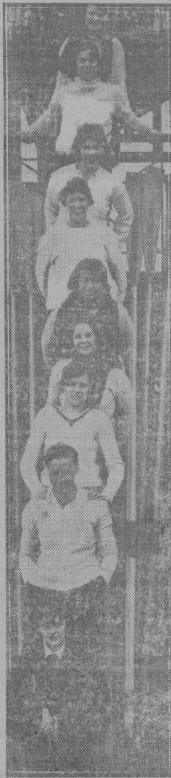
Un grupo de muchachas escolares remeras de la Universidad de Cambridge formadas caprichosamente antes de una regata

Desde las 6 función de cine: «La reina de los cabarets», «Donde las dan las toman» y otras.