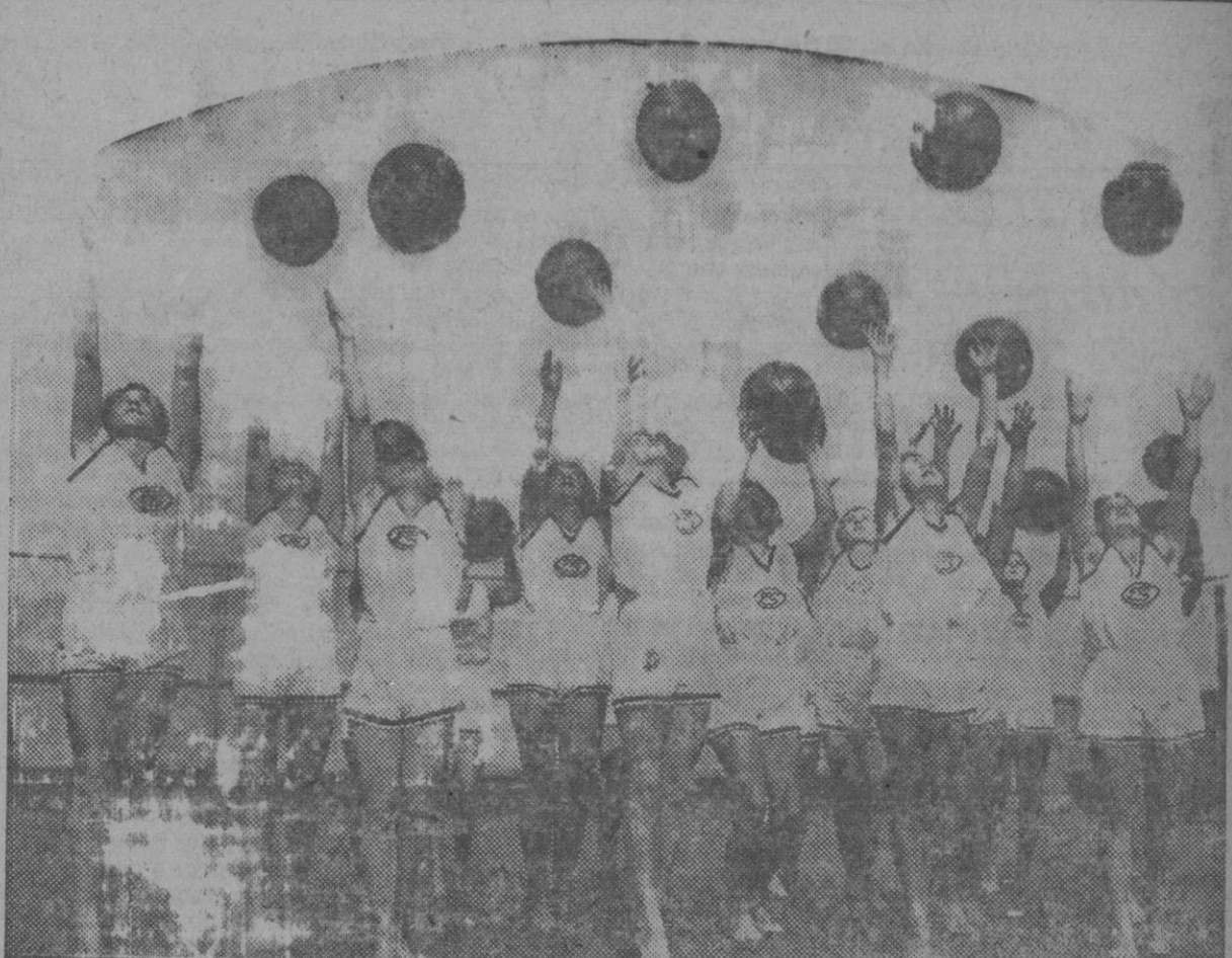
Un grupo de bellas muchachas haciendo ejercicios en las clases de la Escuela de Educación Física de Berlín