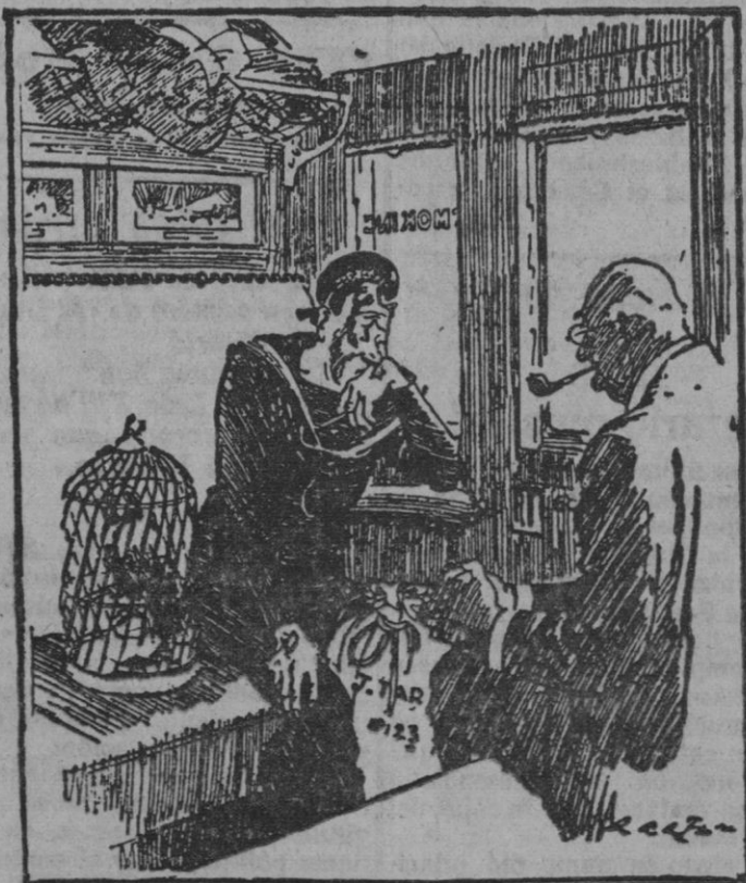
Viaje.—¿Qué le pasa a usted? Mariner.—Que estoy comprometido para casarme y no recuerdo en que puerto me comprometi.

Un aeroplano de los insurrectos mejicanos echó bombas en Nacco (Arizona) resultando un americano herido.