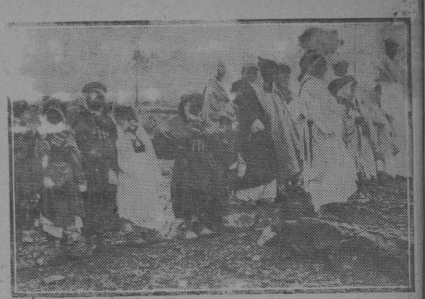
Mujeres indígenas instaladas en El Zúo, donde sus hombres son aparceros con los colonos españoles.

Se reciben esquelas de defunción hasta las tres de la madrugada.