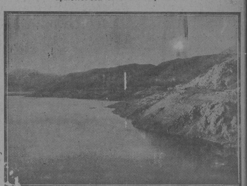
El pantano de Talave