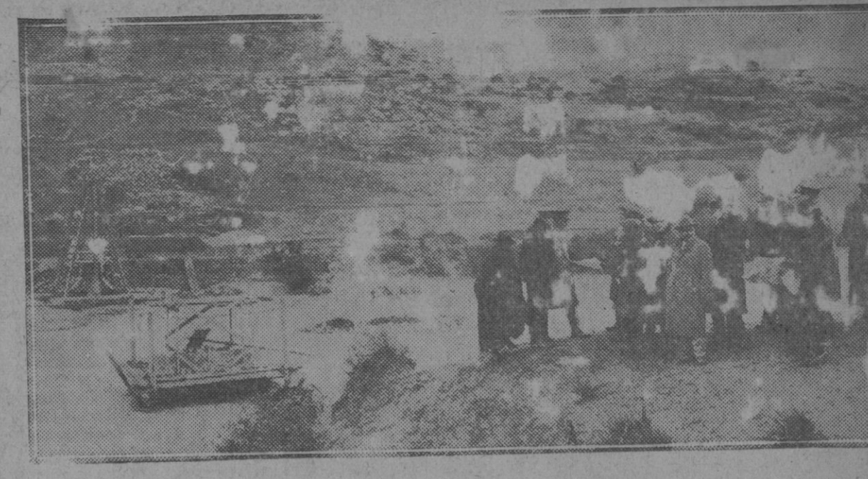
Lugar del Muluya donde se alzan los estribos del puente internacional

Art. 4.º El Gobierno tendrá derecho a designar representantes del Estado en todas las Compañías con-