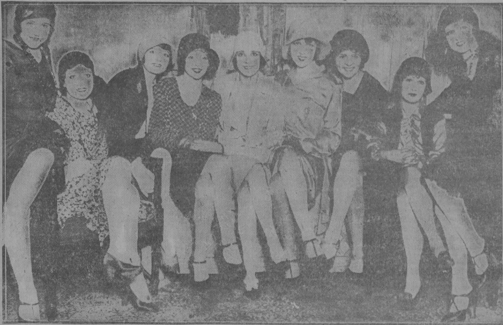
Llegada a la capital neyorquina de los nueve premios de belleza, representativos de los paises y ciudades de Europa, cuyo viaje ha sido organizado por una Agencia Internacional. De izquierda a derecha: Espa1a, Par1s, Alemania, Londres, Rusia, Francia, Austria, Inglaterra y Polonia