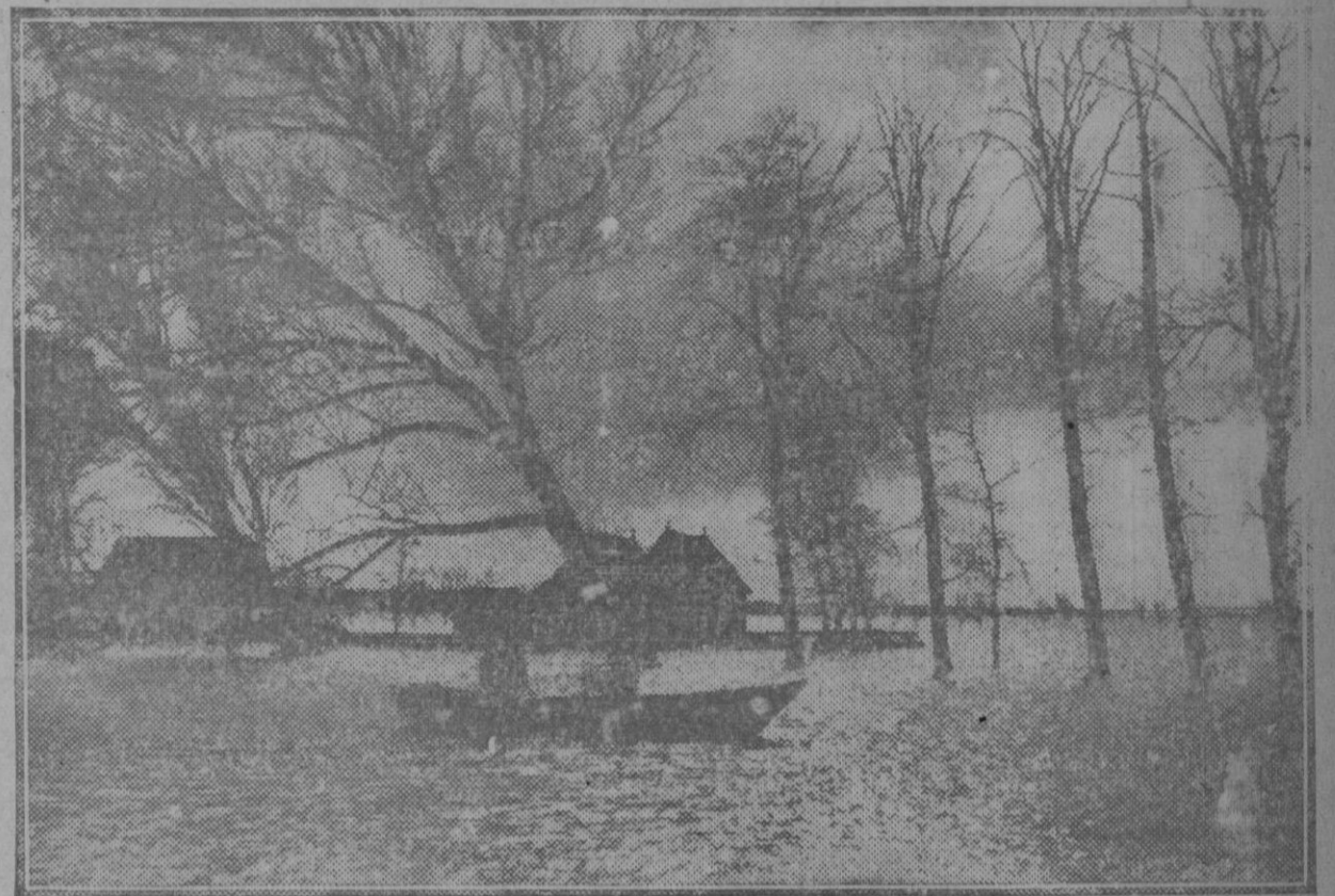
Vista de la isla de Kamper, cerca de la Marken, inundada por las aguas