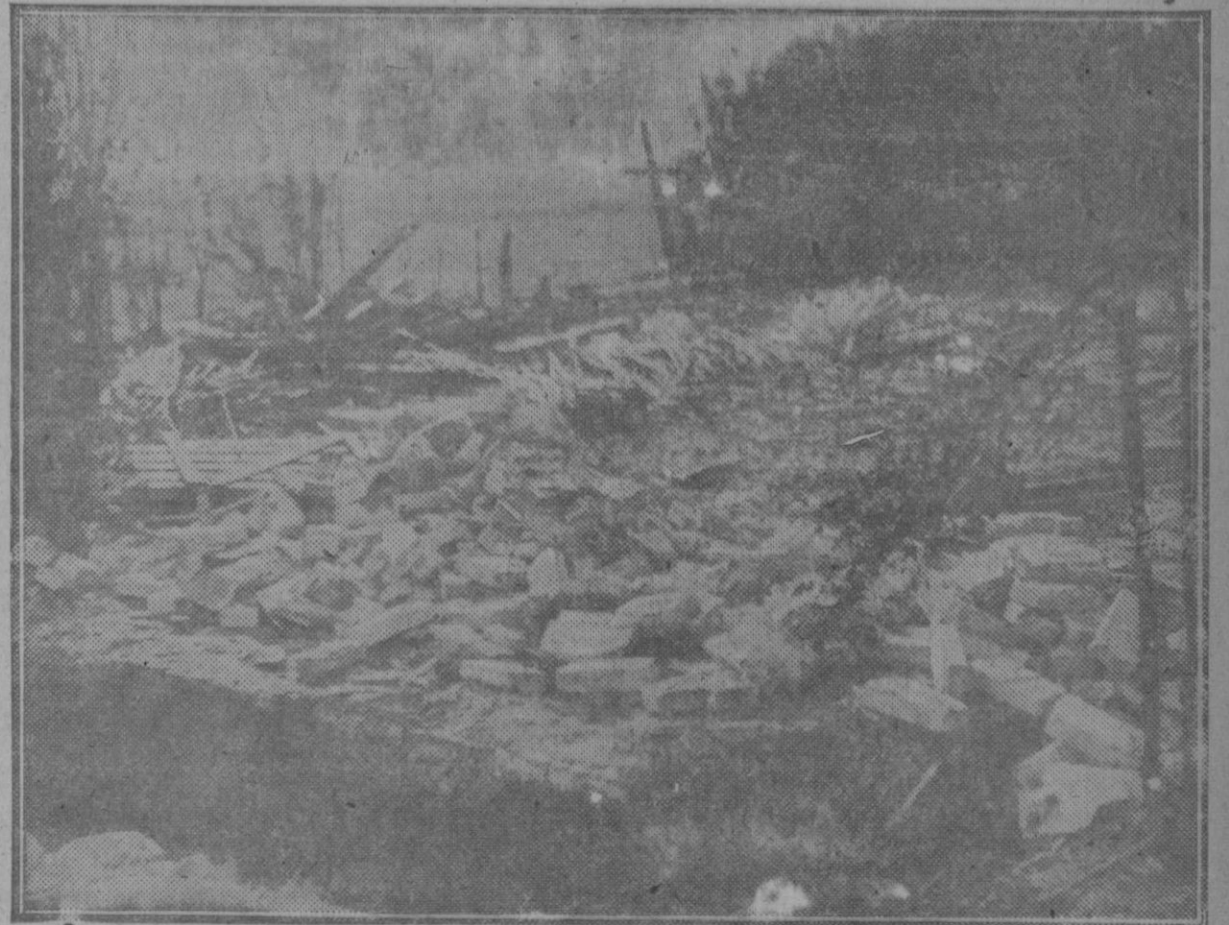
Estado en que qued3 el taller de pirot3cnica despu3s de la explosi3n, que caus3 un muerto y cuatro heridos