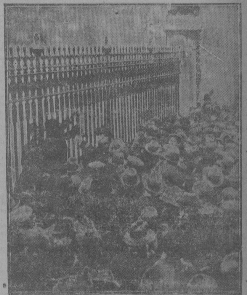
El p1blico londinense, ante el Palacio de Buckingham en el momento de fijar el parte facultativo dando cuenta del estado del Rey