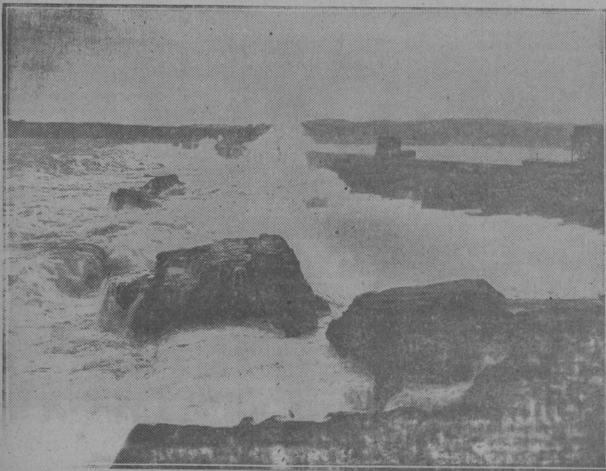
Bilbao: Aspecto del puerto exterior durante el gran temporal en las provincias del Norte