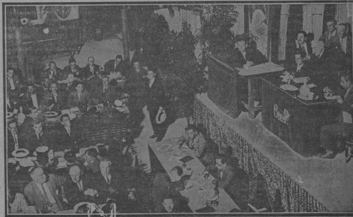
Aspecto del salón-teatro de la Casa del Pueblo al inaugurarse el XII Congreso Socialista