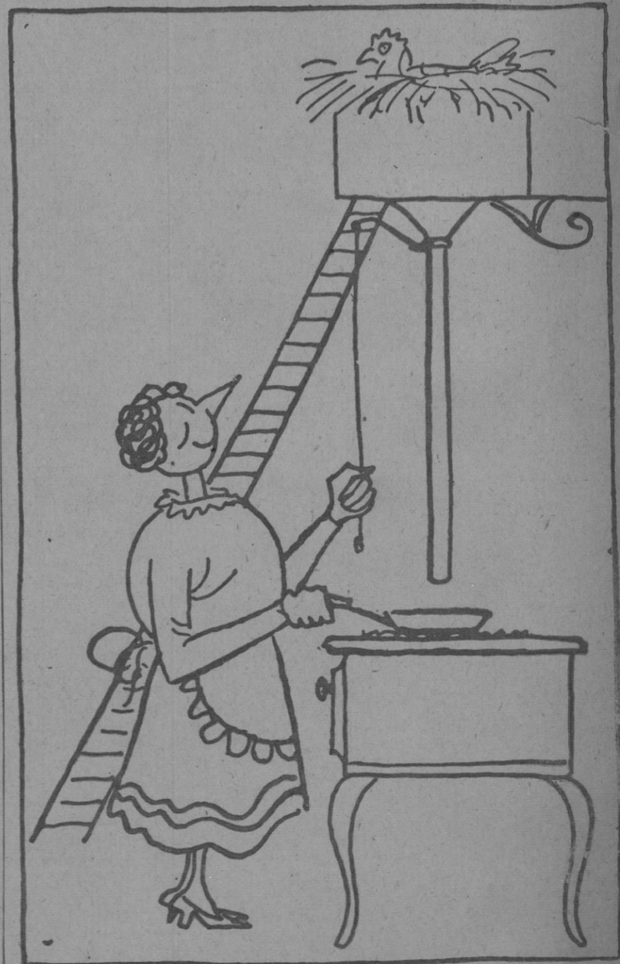
Nuevo aparato para freír huevos... frescos