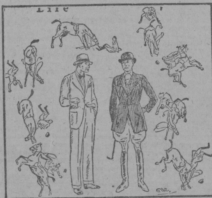
—¿Cuánto le cuestan las lecciones de equitación? —Poco más o menos, diez pesos por caída.