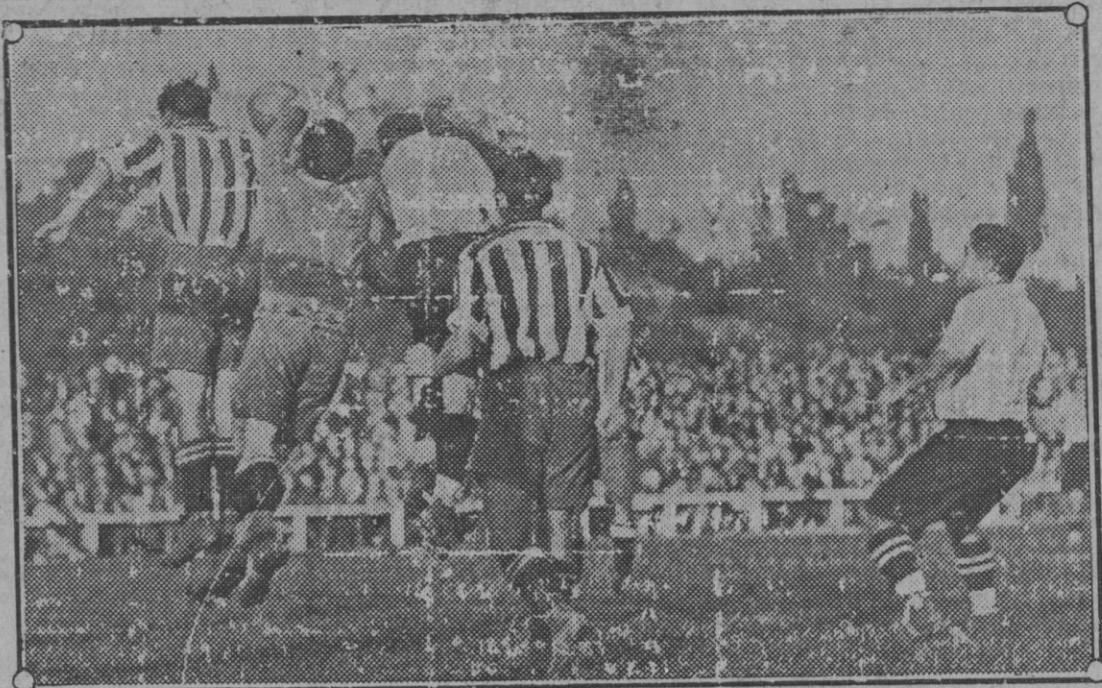
Una oportuna salida de Martínez.