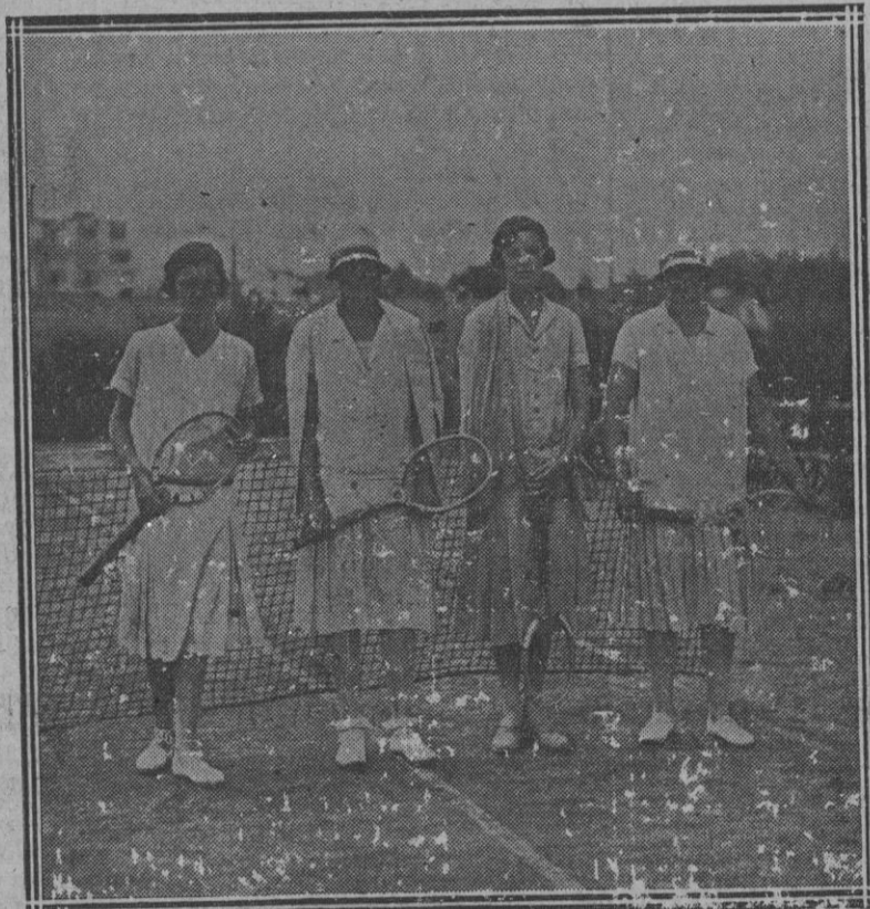
Las Infantas Beatriz y Cristina, con las señoritas de Sarrástegui, retratadas durante un interesante partido de «tenis».