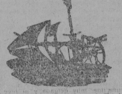
Brabant acero con barra de Triplex

MAQUINARIA Industrial y Agrícola Arados Brabant de los mejores sistemas, fabricados en materiales de alta calidad.