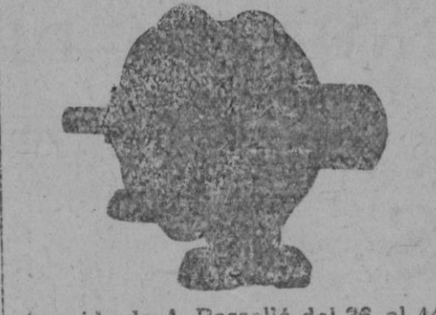
Avenida de A. Rosselló del 36 al 44 Teléfono 3-6-8 - PALMA

MUNNÉ LLOPART Agente exclusivo para la venta en las Baleares de: Los tan renombrados motores eléctricos CH ROULLAND de legítima fabricación francesa, provistos de cojinetes de bolas y eje prolongado que permite la aplicación de otra polea para mover dos máquinas a un mismo tiempo, consumo mínimo y rendimientos máximos a precios limitados