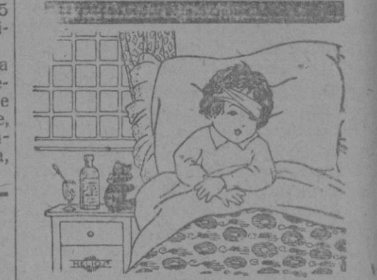
Manolito está en cama. ¿Qué tendrá Manolito?

Prometen verse muy concurridas las carreras ciclistas en carretera que el «Veloz Sport Balear» ha organizado para mañana en el trayecto Palma-Consej-Palma. El número de corredores inscritos es considerable y la lucha se presenta reñida. La meta se situará en el kilómetro 1 de la carretera de Palma a Inca (Hostals Nous) Estos pasados días muchos futuros campeones se han entrenado para disputarse los premios ofrecidos por el «Veloz Sport Balear». Dicha sociedad organiza para muy en breve nuevas carreras algunas de las cuales se celebrarán en el velódromo.