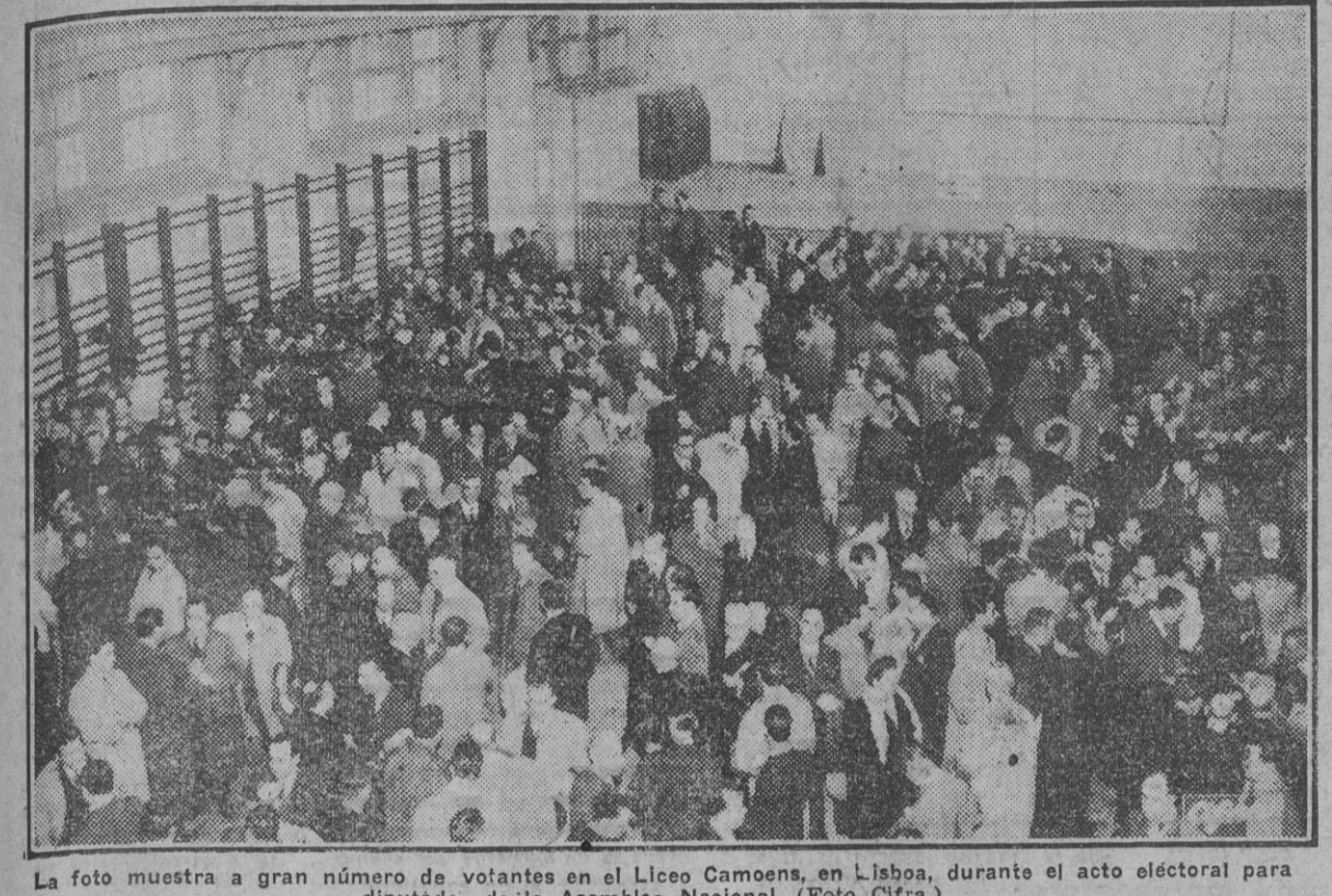
La foto muestra a gran número de votantes en el Liceo Camoens, en Lisboa, durante el acto electoral para diputados de la Asamblea Nacional.