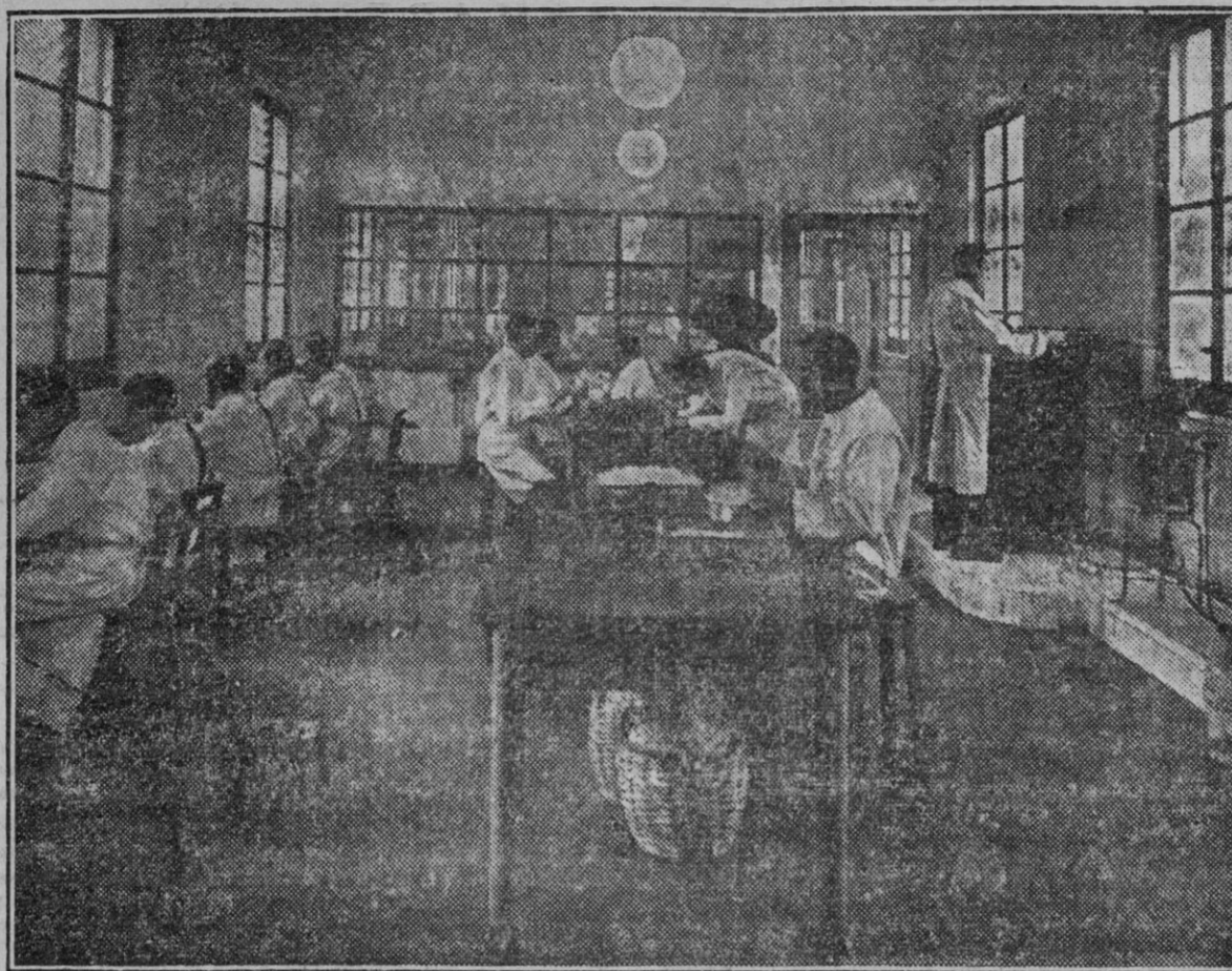
Con el fruto de su trabajo los reclusos españoles atienden a las necesidades de sus familias y ganan, al mismo tiempo, la redención de sus penas. En la foto: el laboratorio de inyectables de la Prisión-Escuela de Madrid.