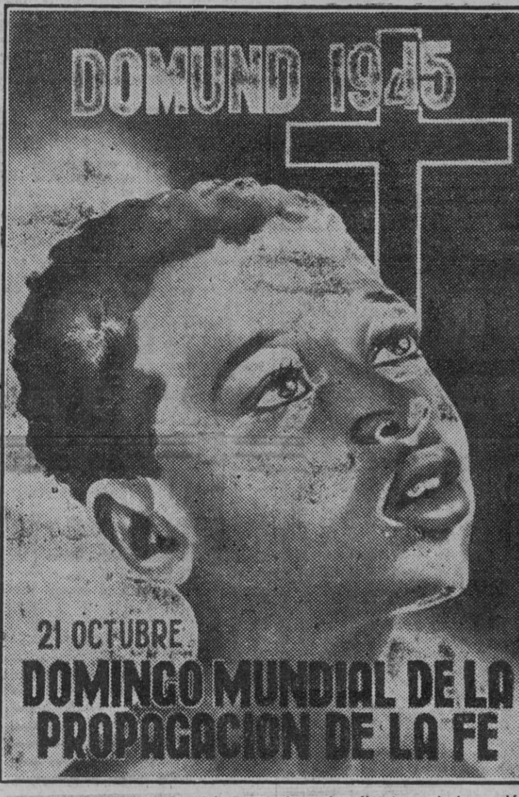
Próxima la celebración del Domingo Mundial de la Propagación de la Fe...

ROMA, 24.- (Crónica radiotelegráfica del enviado especial de la Agencia Efe).