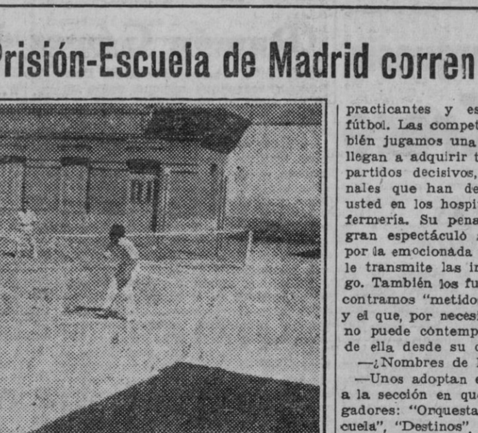
Estos cuatro muchachos tenistas que aquí se ven, en impecable atuendo deportivo, se dedican a su deporte favorito, al aire y al sol, en el patio de la Prisión-Escuela madrileña.

Atletas de la Prisión-Escuela de Madrid corran los 100 metros en 11 s. 2/5