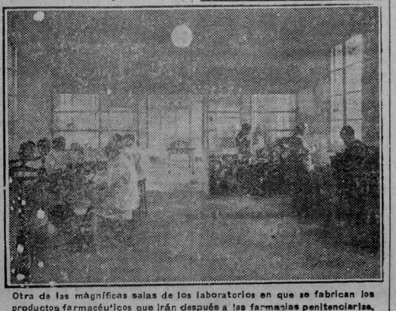
Otra de las magníficas salas de los laboratorios en que se fabrican los productos farmacéuticos que irán después a las farmacias penitenciarias.