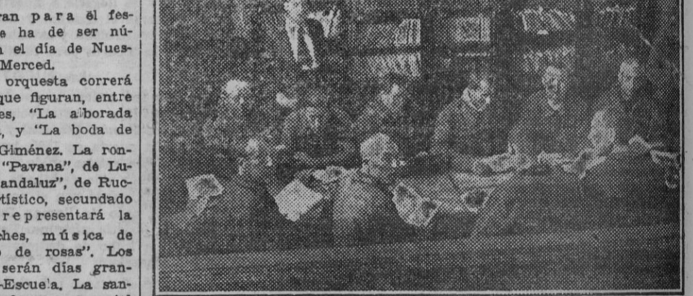
En la biblioteca, donde se sueña y se aprende, la concurrencia es numerosa y renovada.

Las barberías en las prisiones se han desplazado también de los talleres penitenciarios y dependen ahora de la Sección de Ahorros.