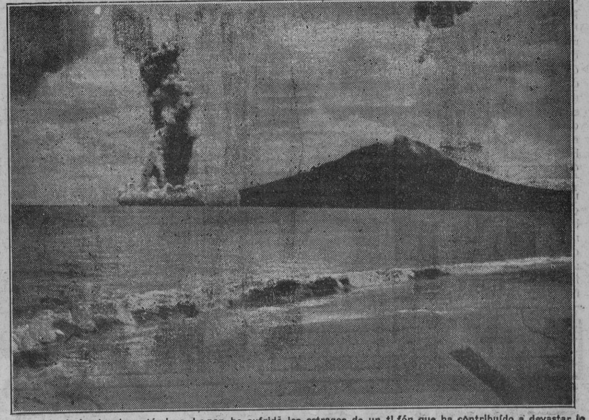
Después de las bombas atómicas. Le pan ha sufrido los estragos de un tifón que ha contribuido a devastar lo que aún quedaba de Hiroshima. El aspecto de la costa de aquellas regiones es desolador.