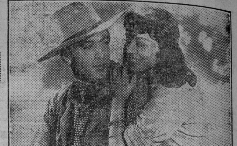
Gary Cooper y Paulette Goddard en una escena de "Policia Montada del Canadá", el maravilloso film en technicolor que será presentado por Distribuidora Chamartín hoy, lunes, en el cine Avenida.