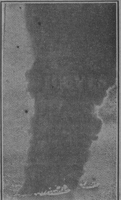
Un petrolero japonés, que ha sido alcanzado por las bombas de un aparato británico, comienza a arder, y de él se eleva una gran columna de humo negro al incendiarse el combustible.