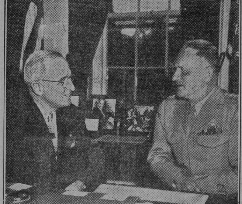
El Presidente Truman conversa en la Casa Blanca con el general Carl A. Spaatz, comandante general de las fuerzas aéreas estratégicas americanas en Europa.