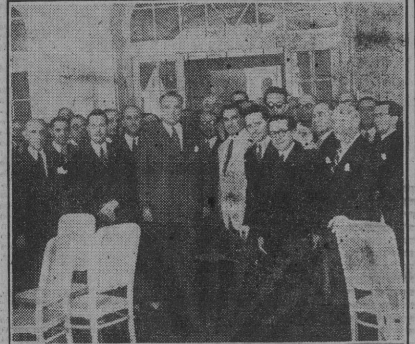
Del homenaje rendido por el Cuerpo de Prisiones al ministro de Justicia, acto del que ayer publicamos la oportuna información.