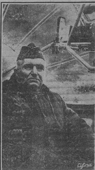
El teniente general norteamericano Simón Bolívar Buckner, muerto en la batalla de Okinawa.