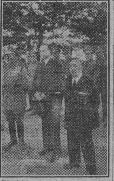
El ministro de la Gobernación y director general de Seguridad, durante su visita realizada ayer tarde a la Escuela de la Policía Armada. (Información en 2.ª página).