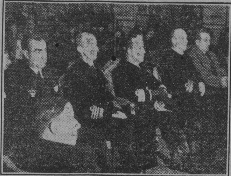
El ministro de Marina en la presidencia de los funerales celebrados esta mañana en memoria de los gloriosos caídos del crucero "Baleares"...