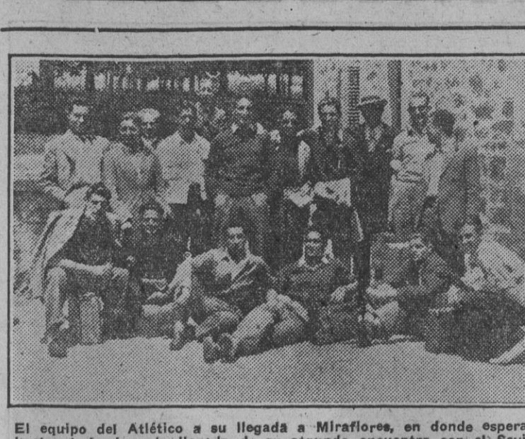
El equipo del Atlético de A. Miraflores, en donde se separa hasta el domingo la llegada de su segundo encuentro con el Sevilla por la Copa.