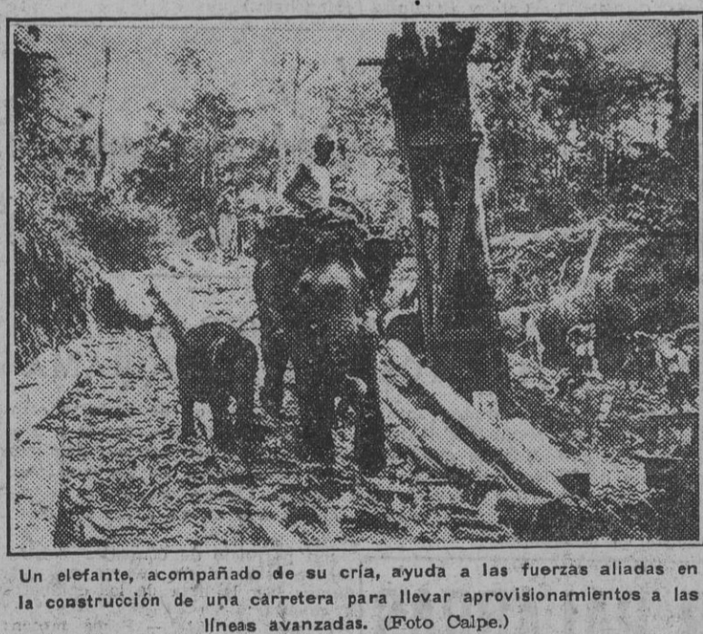
Un sifon, acompañado de su cría, ayuda a las fuerzas aliadas en la construcción de una carretera para llevar aprovisionamientos a las líneas avanzadas.