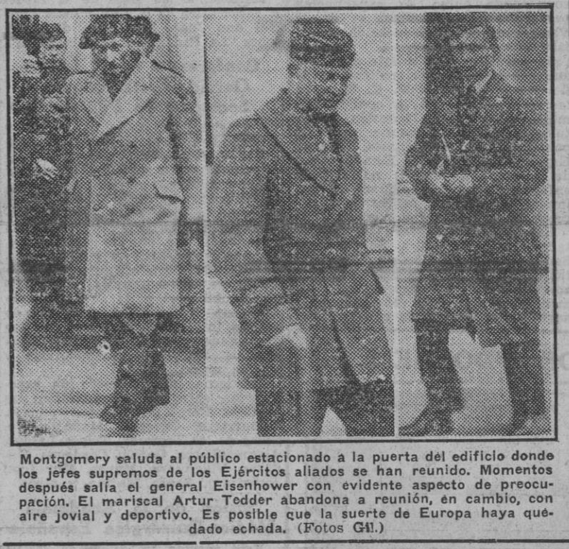
Montgomery saluda al público estacionado a la puerta del edificio donde los jefes supremos de los Ejércitos aliados se han reunido. Momentos después salía el general Eisenhower con el aspecto de preocupado. El mariscal Artur Todder abandona a reunión, en cambio, con aire jovial y deportivo. Es posible que la suerte de Europa haya quedado echada.