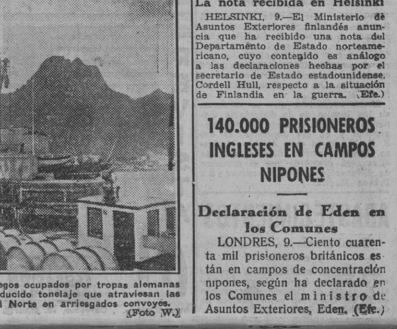
Constantemente, a los puertos noruegos ocupados por tropas alemanas llegan suministros en barcos de reducido tonelaje que atraviesan las aguas peligrosas de los mares del Norte en arriesgados convoyes.