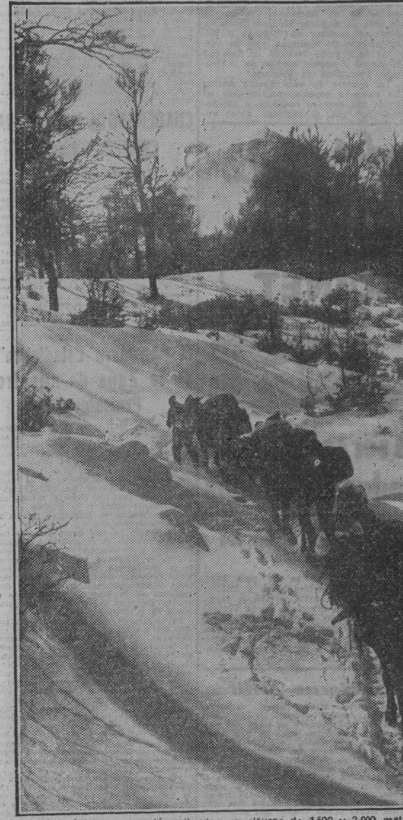
A las posiciones que están situadas en alturas de 1.500 y 2.000 metros se llega por un sendero estrecho y resbaloso sobre la nieve. Las dificultades de transporte no impiden el aprovisionamiento. (Foto Orbis).