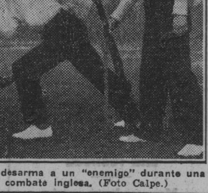
Un instructor muestra cómo se desarma a un “enemigo” durante una lección en una escuela de combate inglesa.