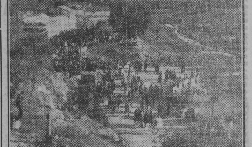
Aspecto que ofrecían los terrenos del arroyo de Pedroche, donde se ha celebrado la tradicional romería de la Candelaria.