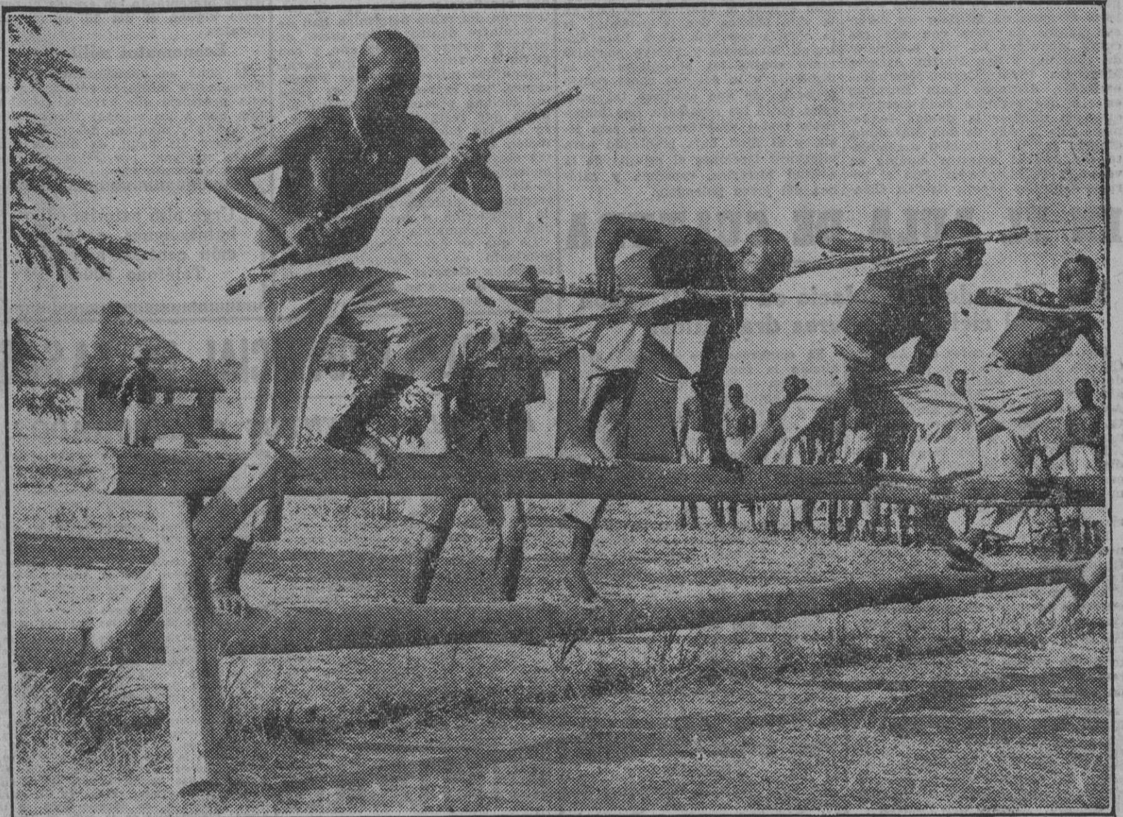
En la Nigeria británica se intensifica el adiestramiento de combatientes de color para los ejércitos aliados. He aquí un grupo de reclutas negros practicando ejercicios de asalto a la bayoneta en un campo de instrucción.