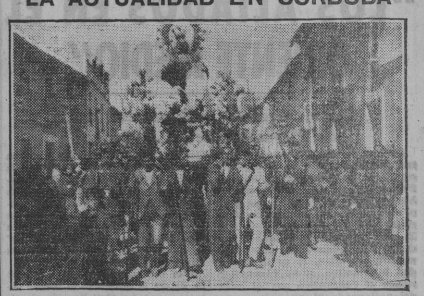
La procesión de la Virgen de la Luz, que recorrió las principales calles de la capital cordobesa.