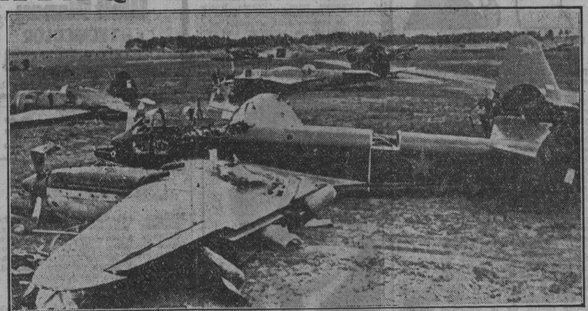
Estado en que quedó un aeródromo ruso después del ataque aéreo alemán.