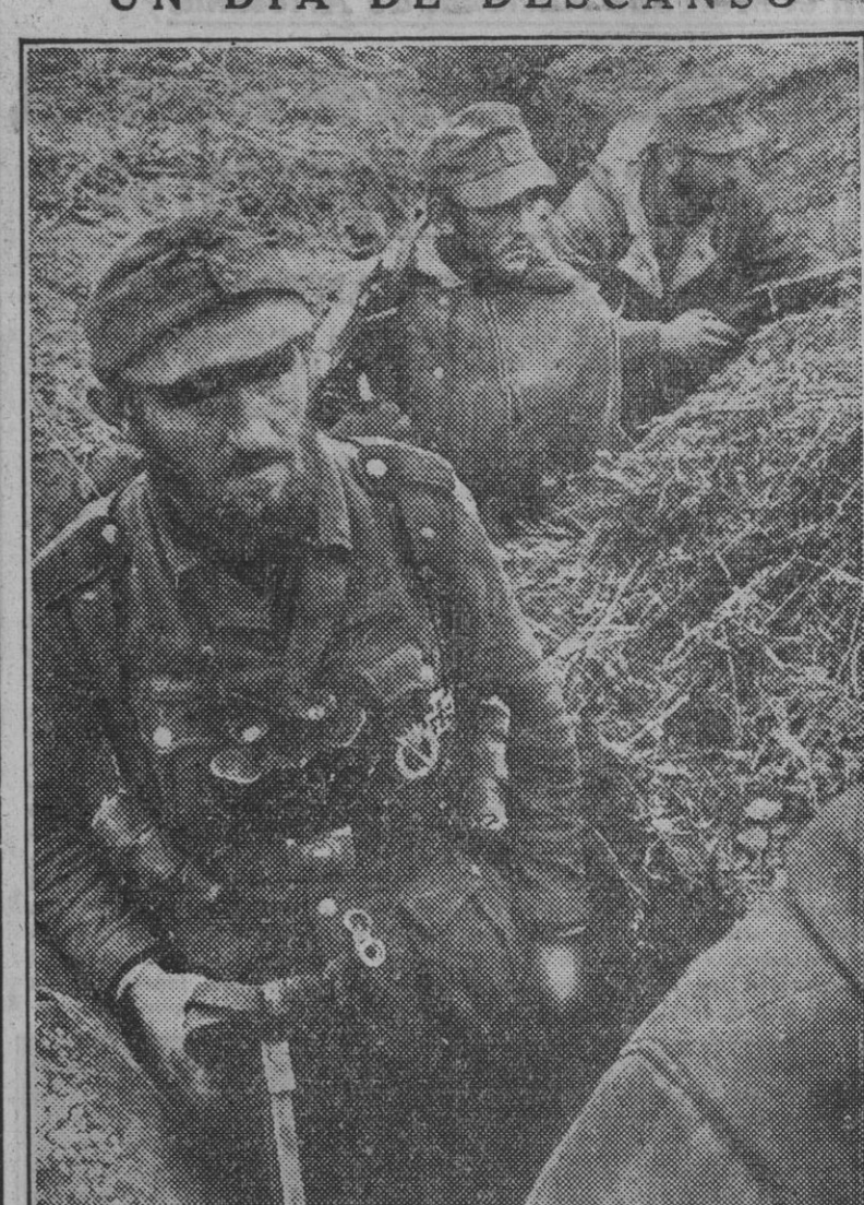
Después de permanecer durante diez días en un puesto avanzado en una cabeza de puente del Est, este primer cabo tiene bien ganado el día de descanso que le es concedido y se dispone a disfrutarlo..