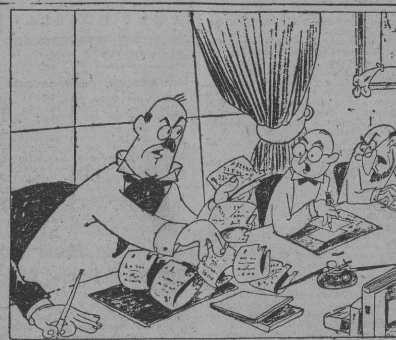
INFORME APRESURADO, por Bellón —¡Señores! Como no he tenido tiempo de poner en limpio las notas de mis gestiones, tomadas en los puños, voy, con ayuda de ellos, a informaros de mis gestiones.

El camarada Valcárcel leyó en la sesión de ayer un telegrama del ministro secretario general del Movimiento, redactado en los siguientes términos: "Al iniciar tareas VI Consejo Nacional, os envío mi más afectuoso saludo, a la vez que pido a Dios os ilumine para que fructifiquen en provechosas realidades los nobles estímulos de las camaradas de este Sindicato. ¡Arriba España! Firmado, José Luis Arrese."