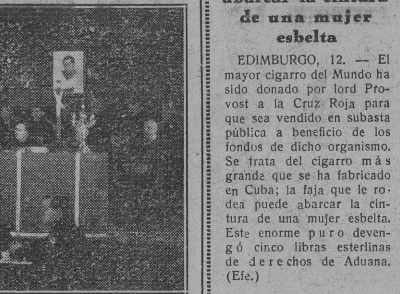
La Mesa presidencial del VI Consejo Nacional del S. E. U., que actualmente se celebra en Santiago de Compostela.

La sesión de clausura será retransmitida por radio el viernes