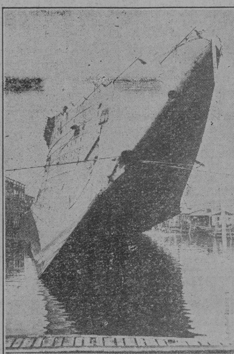
El vapor "Lafayette", antiguo "Normandie", después de haber reducido su escora en 35 grados, durante la fase final de volver a poner a flote al barco. (Foto A.)

Acaso está cercana la hora de la paz. Ya son muchas las personas que sobre tal supuesto piensan en el posible salvamento de los inmensos tesoros sepultados en el mar; tesoros por el valor de los castos y los argamentos perdidos, y para siempre. En muchos casos, y para siempre. La profundidad media de los océanos rebasa los cuatro kilómetros; la máxima llega a los diez. Los buques hundidos en las grandes depresiones del Atlántico y el Pacífico no volverán a la superficie. Pero son muchos los que reposan cerca de las costas o en la vecindad de puertos, en aguas de poco fondo, donde el salvamento, si no seguro, es cuando menos probable.