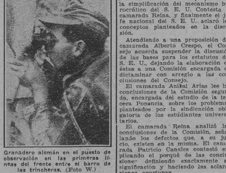
Granadero alemán en el puesto de observación en las trincheras.