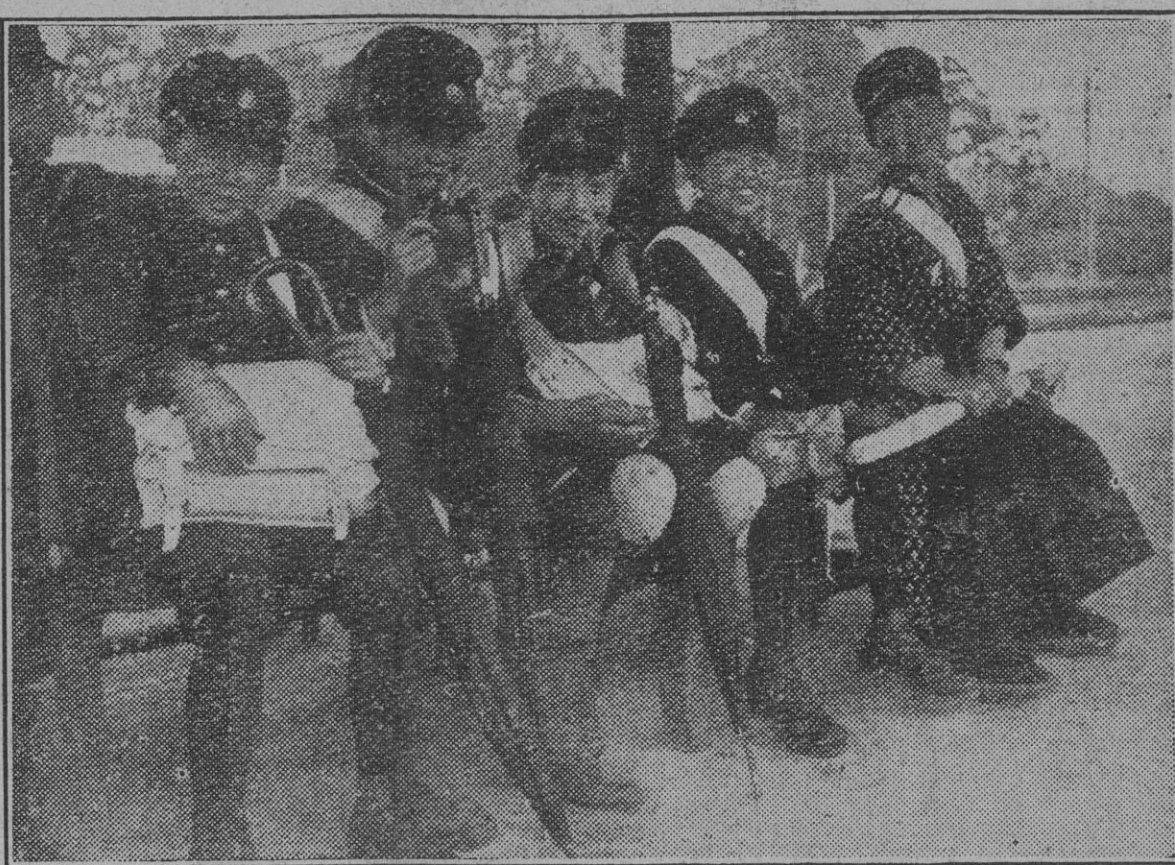
En el país del Sol Naciente los niños tienen que ir al colegio en tranvía. Algunos llevan quimonos, según costumbre antigua, pero la mayoría de las veces llevan los trajes uniformados, las mochilas sin blancos. Muy originales son los grandes paraguas, que tampoco pueden faltar.