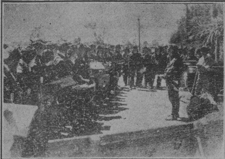
Antes de partir hacia los objetivos, los pilotos japoneses reciben las últimas instrucciones.