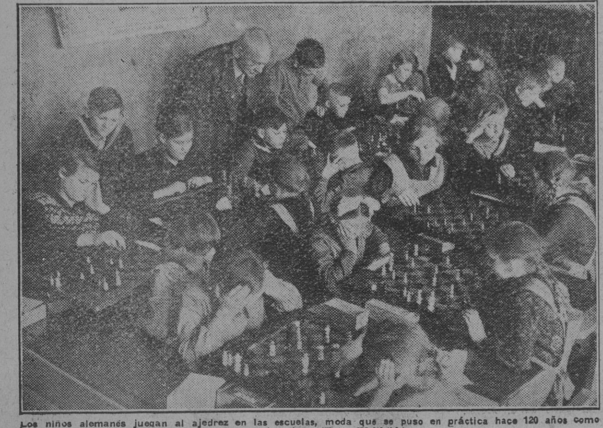
Los niños alemanes juegan al ajedrez en las escuelas, moda que se puso en práctica hace 120 años como método educativo.