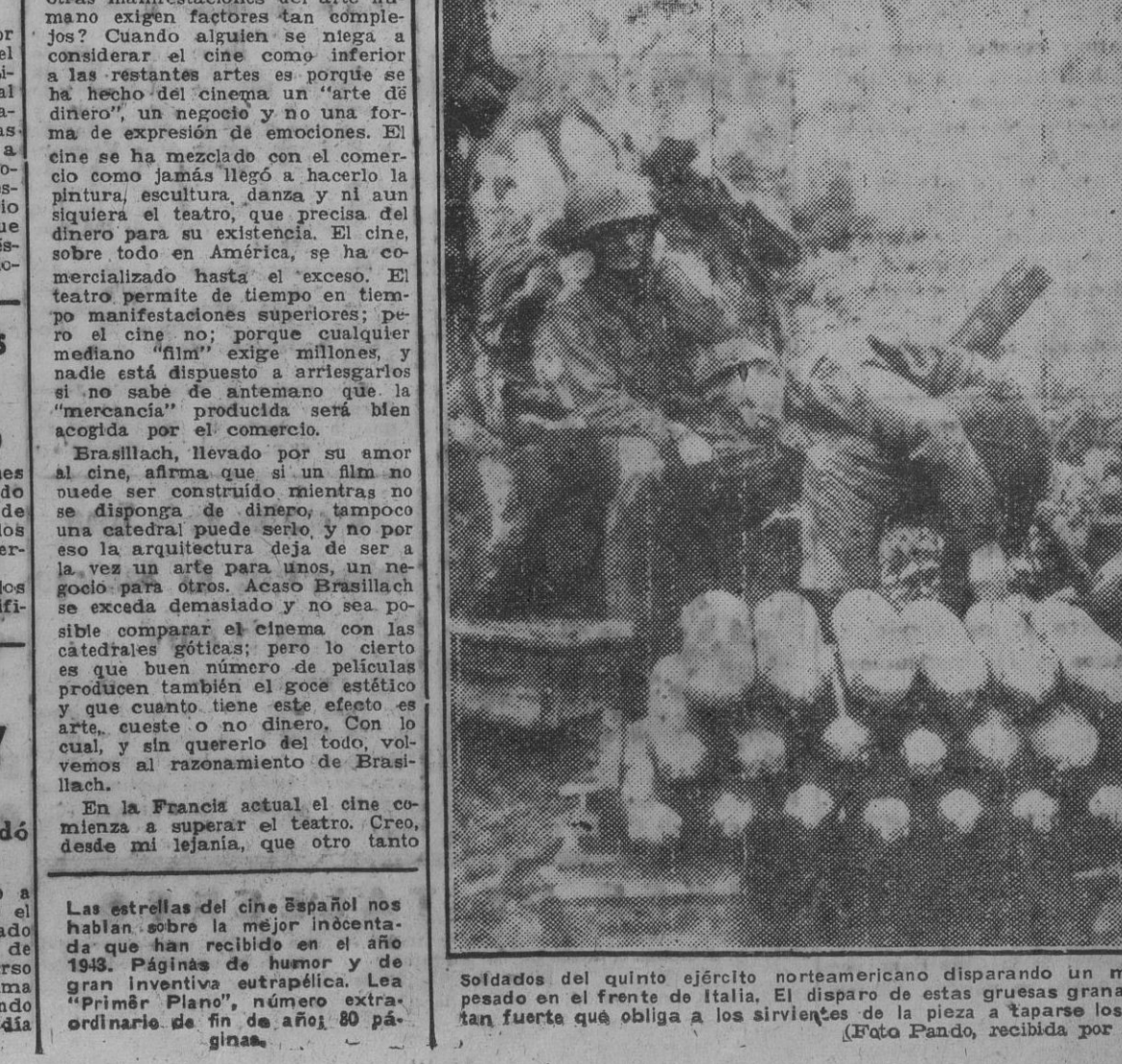
Soldados del quinto ejército norteamericano disparando un mortero pesado en el frente de Italia. El disparo de estas gruesas granadas es tan fuerte que obliga a los sirvientes de la pieza a taparse los oídos.