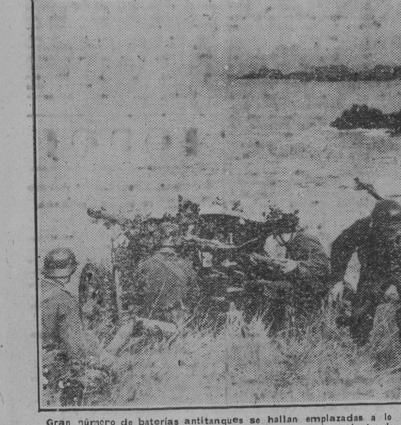
Gran número de baterías antiaéreas se hallan emplazadas a lo largo de la costa francesa en el Atlántico. La fotografía recoge una escena durante el emplazamiento de una de aquellas piezas.