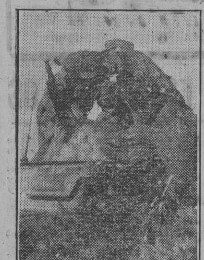
Antes de comenzar el ataque la tripulación de un carro alemán realiza los últimos preparativos.