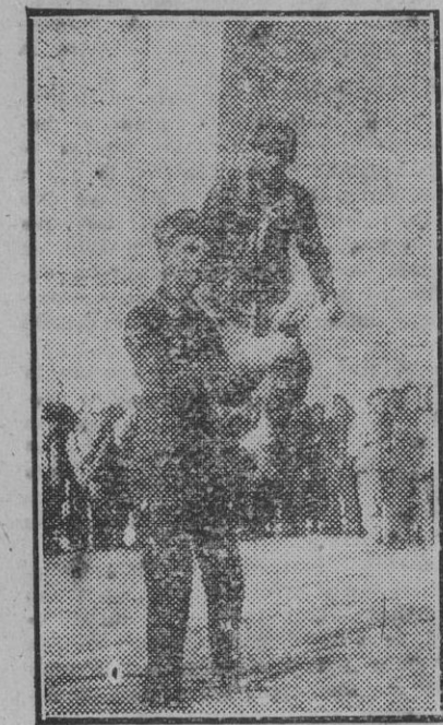
Un instructor de paracaidistas explicando una lección práctica en el patio de una escuela alemana, especialmente dedicada a preparar "soldados del aire".

MELBOURNE, 5.—El comunicado del Cuartel General aliado del sur del Pacífico anuncia que en la península de Huon las fuerzas australianas han avanzado unos 15 kilómetros más allá de Nuan. En su progresión a lo largo de la costa—afade—, las tropas australianas han rebasado S'lim y se dirigen hacia Kelana. (Efe.)