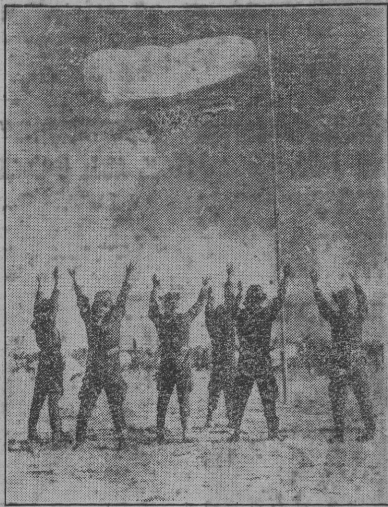
Aviadores japoneses en una isla del Pacífico saludan al símbolo del dragón, izado con motivo de celebrarse el Día de la Juventud.