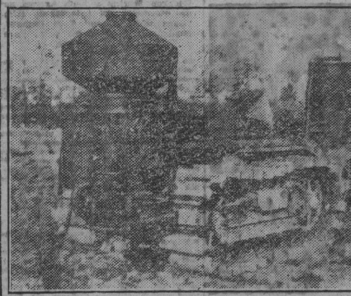
Un campesino holandés ha resultado la escasez de gasolina aplicando a su tractor agrícola un motor de gas de madera, que funciona perfectamente. Su ejemplo ha sido imitado ya por muchos labradores.