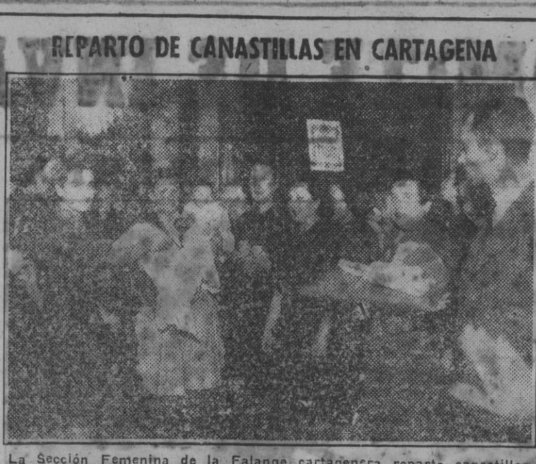
REPARTO DE CANASTILLAS EN CARTAGENA. La Sección Femenina de la Falange cartagenera reparte canastillas con motivo de la festividad de Reyes.

Importante industria metalúrgica situada en una de las poblaciones del Norte y dedicada a trabajos de maquinaria y calderería necesita cubrir la plaza de jefe de talleres. Dirigirse a este periódico indicando años de práctica, referencias y pretensiones. Reserva absoluta.