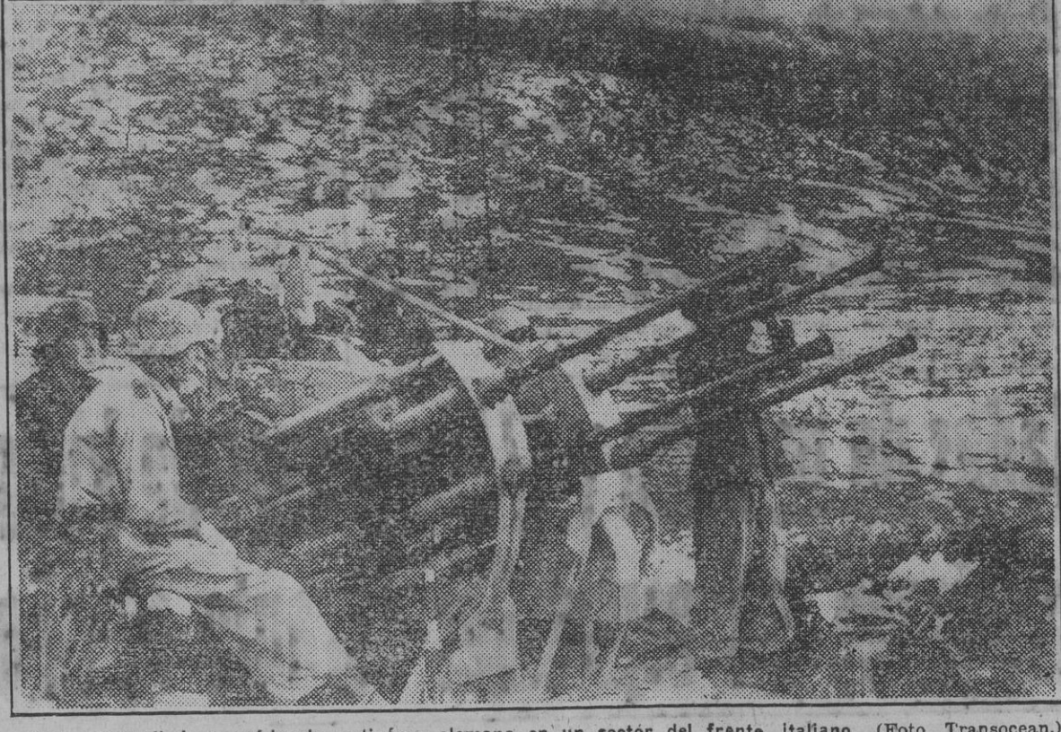
Una ametralladora cuádruple antiaérea alemana en un sector del frente italiano.