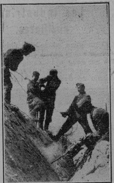
En las montañas francesas de la costa mediterránea proceden estos soldados a la colocación de alambradas, como complemento de la barrera defensiva que protege el sur de Europa.