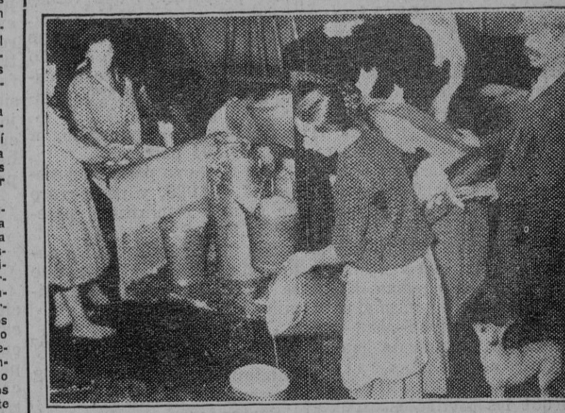
Una lechería en una granja del distrito de Cracovia.

ALGECIRAS, 30.—En un telegrama de Londres, "La Gaceta Oficial de Gibraltar" anuncia que los japoneses han puesto en servicio un buque construido de caucho que, al llegar al puerto de destino, puede desguazarse para convertirse en productos de todas clases, con aplicaciones diversas. Sirve además para transportar materias primas de los países conquistados.