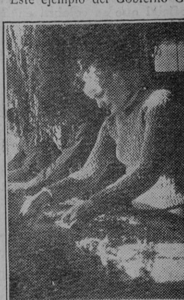
Jóvenes de Gora tejiendo artísticos tapices.

En el primer año de organización escasamente se pudieron cubrir las necesidades del propio Gobierno General. Por el contrario, en el segundo año ya se tuvo un excedente de producción agrícola, que se dedicó al abastecimiento de las tropas concentradas contra la U. R. S. S. Y, por último, en el tercer año, no sólo se cubrieron estas necesidades, sino que incluso un excedente importante de productos agrícolas fueron enviados al Reich.