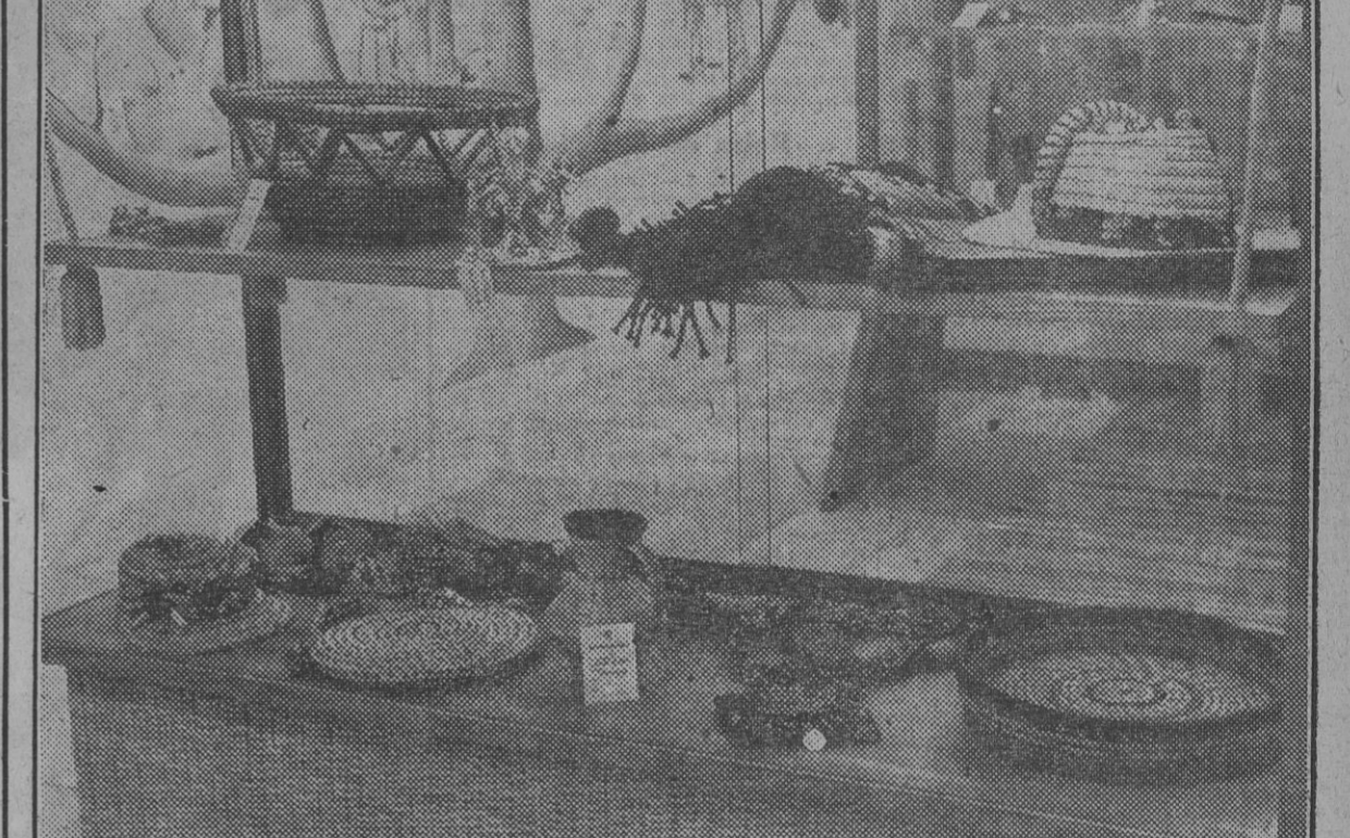
Bello conjunto de objetos confeccionados de esparto, rafia, mimbre y paja, expuestos en el Mercado de Artesanía.

El suplemento de "Arriba", "81", de día 1 recoge una vez más el problema de actualidad: "EL PROBLEMA DE LA VIVIENDA EN ESPAÑA".