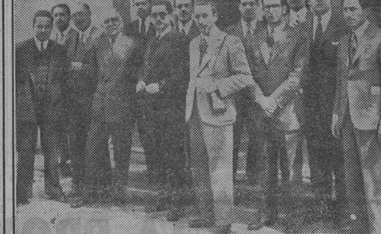
Alumnos del último año de la Escuela de Arquitectura de Barcelona...