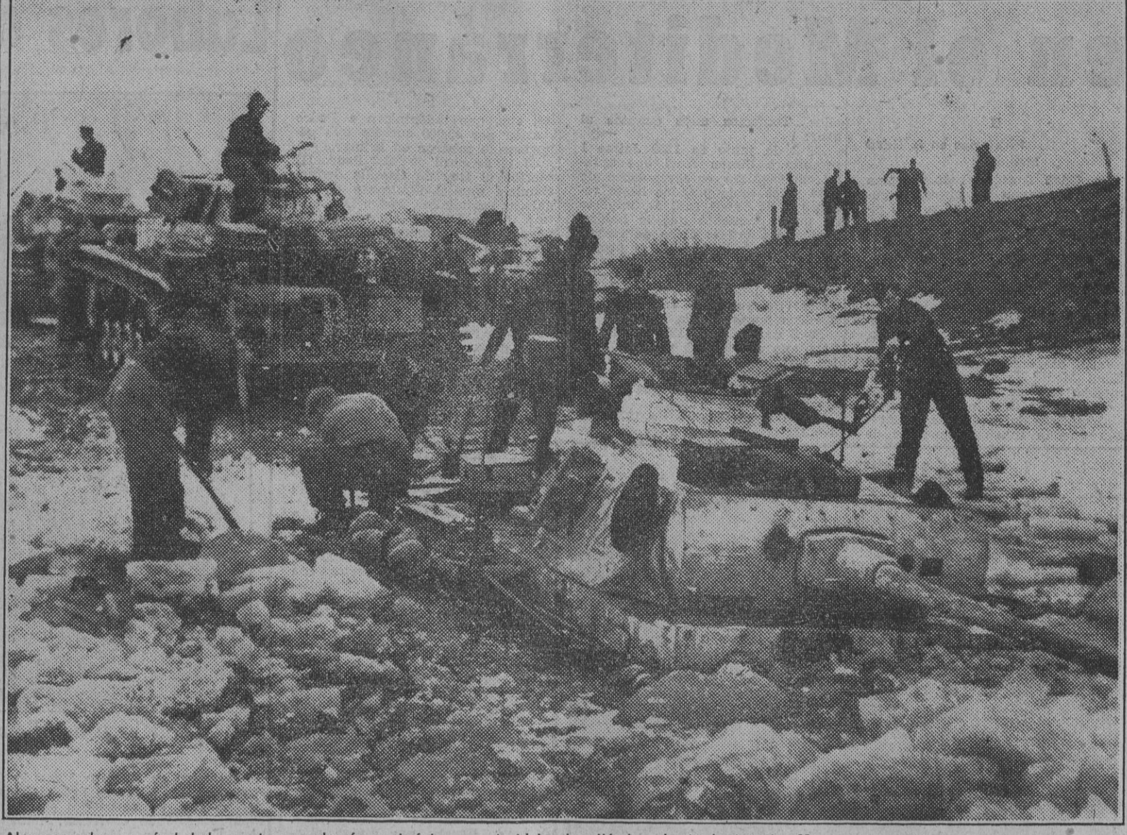
Al pasar sobre un río helado, un tanque alemán quebró la capa de hielo, hundiendo hasta la torreta. Momento de iniciarse las operaciones para "ponerlo a flote".

Por una razón o por otra, se nota en el correspondiente norteamericano una mayor sensatez que en el inglés, pues esta calma sistemática todo detalle desfavorable o no duda en caer en la exageración, dando con frecuencia un panorama excesivo de la situación de Rusia, origen siempre de posteriores desilusiones. En cambio, el norteamericano no se priva de transmitir el aspecto optimista a través de lo que observa. De las dos fotografías de referencia muestra la primera a un grupo de mujeres surtidas de agua obtenida de nieve derretida y recogida en canchales. La fotografía lleva este pie: "Después que los alemanes bombardearon los depósitos, el único agua disponible de las cavañadas al hielo en el río Neva. Las epidemias han causado terribles estragos." La segunda foto reproduce una amplia avenida de San Petersburgo, con escasos transeúntes. En primer plano se ve a un hombre de espaldas tirando de un atado cargado sobre un mulo; el conductor de este vehículo, "Un atado es arrastrado a mano por una calle de Leningrado. El pasado invierno millones de ciudadanos dejaron de declarar la guerra a familiares para seguir obteniendo las raciones de los muertos."