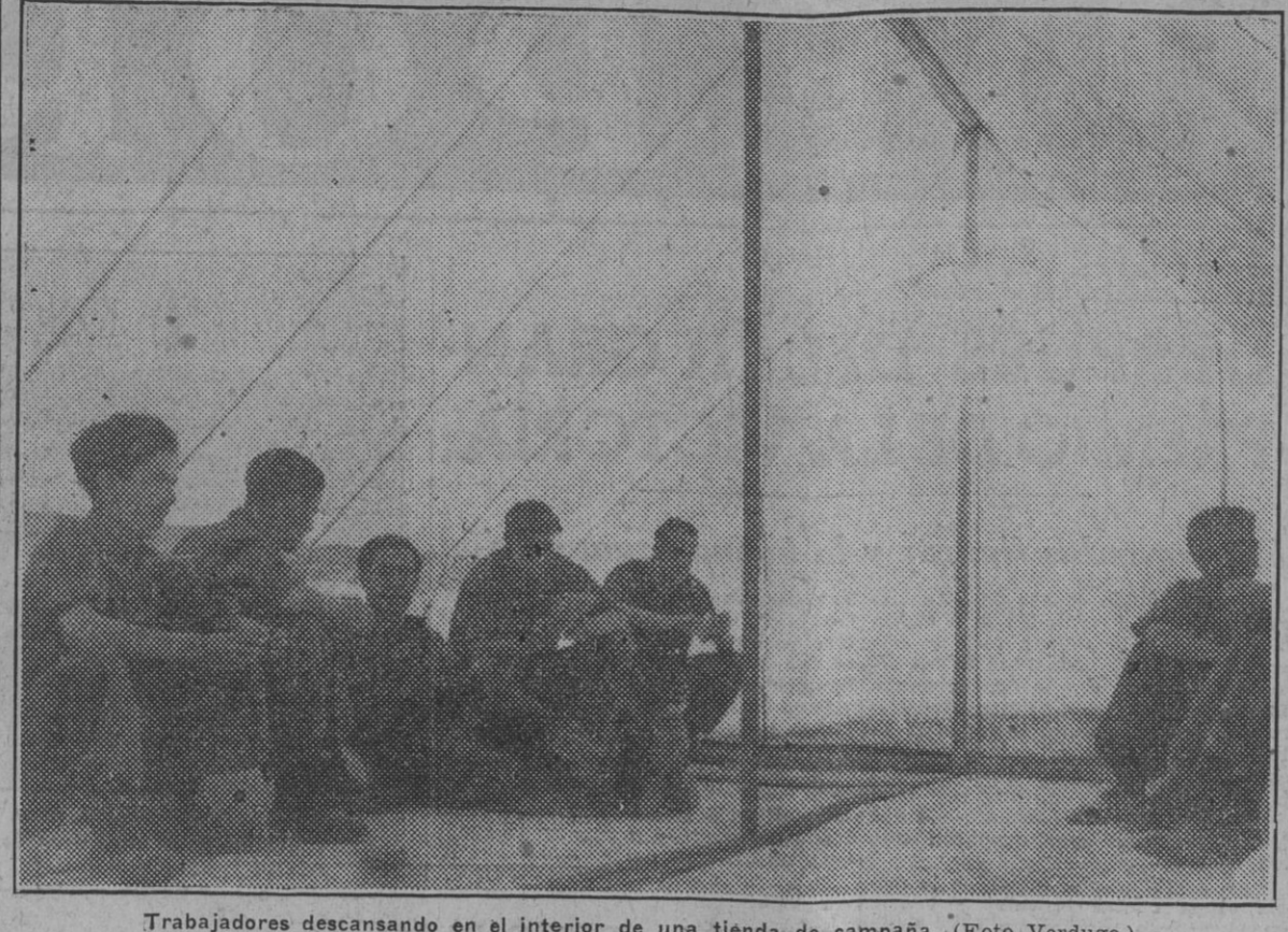
Trabajadores descansando en el interior de una tienda de campaña.

En la frontera del Este unos miles de españoles montan la guardia para evitar la invasión bárbara en la geografía de Europa. ¿Estamos seguros de corresponder a su esfuerzo montándola nosotros en el confin de la Patria para impedir la invasión de esos mismos bárbaros—que no están encerrados en campamentos estancos—en el mundo sutil y peligroso de las ideas? Y ésta sí que debe ser la voz española en la batalla del Mundo; pero sin olvidar que los pueblos tienen también una visera parecida al estómago. Ni feja de vanidades, en la que nos contentemos con un adjetivo más para la leyenda heráldica del heroísmo hispano, ni sucio mercado en el que se arrojen a la voracidad de los perros de presa trozos sangrantes de la fiera vencida. La verdad española en su integridad, aquel orden que también sabía apoyarse en la fuerza.