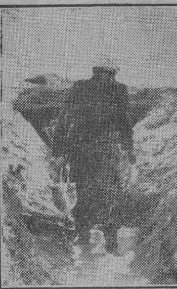
Soldado alemán de una "brigada de deshielo" en una zanja abierta en la nieve. La primavera en el Este ha traído, junto a la derrota del "general invierno", un nuevo enemigo, menos peligroso, pero más molesto quizá: el fango.