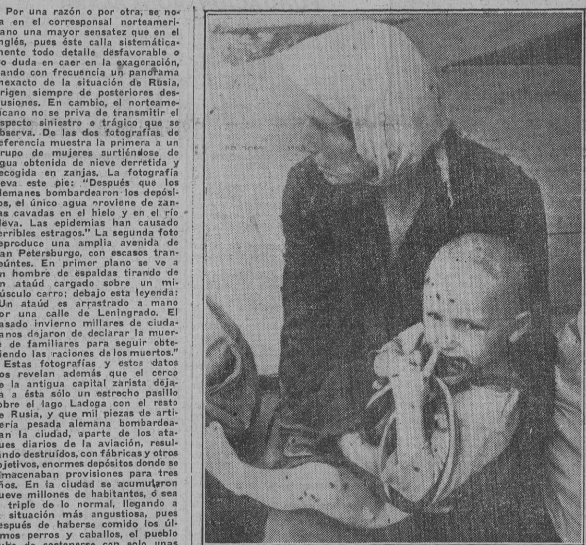
Hambre, miseria, enfermedades... He aquí un doloroso exponente de la Rusia comunista.

Por una razón o por otra, se nota en el correspondiente norteamericano una mayor sensatez que en el inglés, pues esta calma sistemática todo detalle desfavorable o no duda en caer en la exageración, dando con frecuencia un panorama excesivo de la situación de Rusia, origen siempre de posteriores desilusiones. En cambio, el norteamericano no se priva de transmitir el aspecto optimista a través de lo que observa. De las dos fotografías de referencia muestra la primera a un grupo de mujeres surtidas de agua obtenida de nieve derretida y recogida en canchales. La fotografía lleva este pie: "Después que los alemanes bombardearon los depósitos, el único agua disponible de las cavañadas al hielo en el río Neva. Las epidemias han causado terribles estragos." La segunda foto reproduce una amplia avenida de San Petersburgo, con escasos transeúntes. En primer plano se ve a un hombre de espaldas tirando de un atado cargado sobre un mulo; el conductor de este vehículo, "Un atado es arrastrado a mano por una calle de Leningrado. El pasado invierno millones de ciudadanos dejaron de declarar la guerra a familiares para seguir obteniendo las raciones de los muertos."