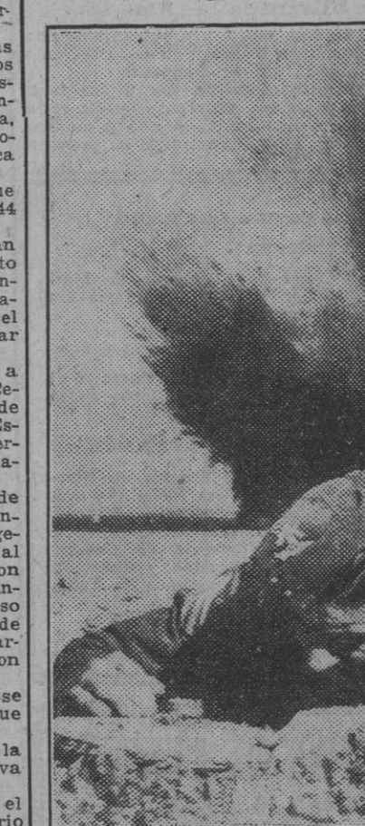
Un alumno de la escuela de entrenamiento de Zapadores ingleses en Egipto desenterra una mina anticarro con trampa y sin que se oiga la explosión de otra, conectada con la primera, a cierta distancia. De este modo los especialistas aprenden a tomar precauciones.