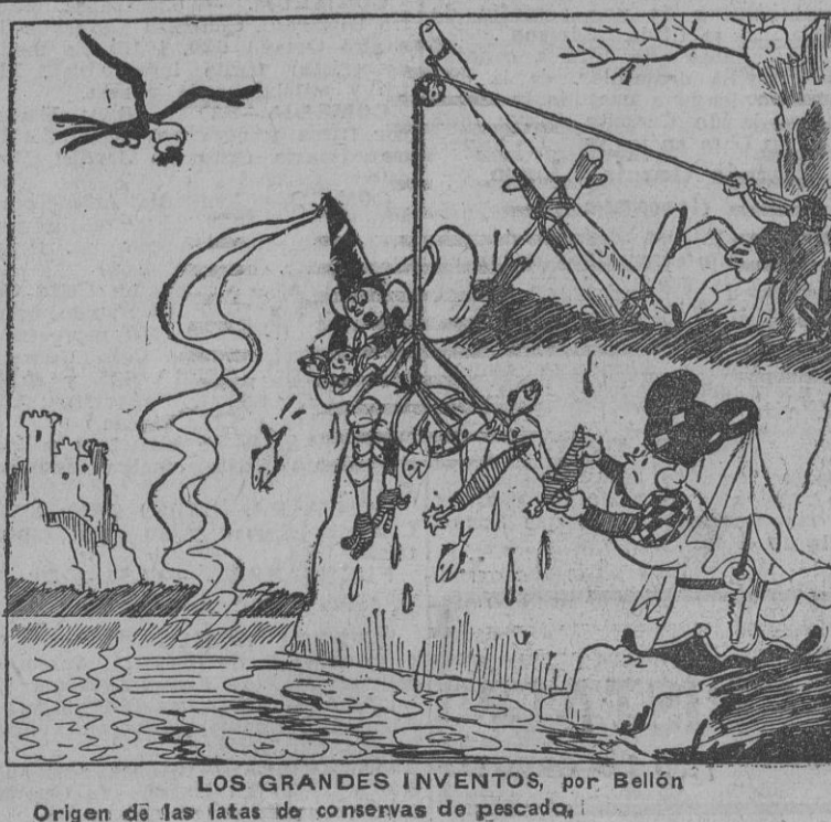
LOS GRANDES INVENTOS, por Bellón

Origen de las latas de conservas de pescado.