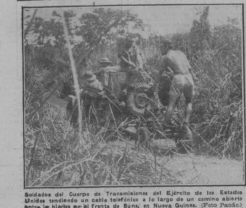
Soldados del Cuerpo de Transmisiones del Ejército de los Estados Unidos...