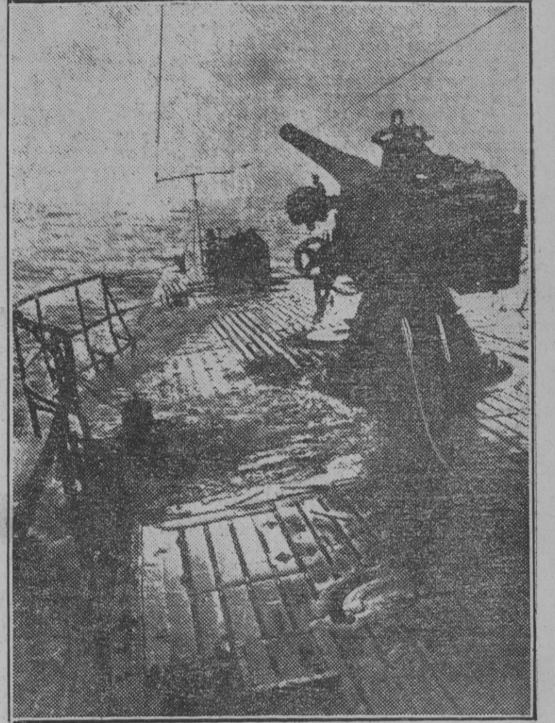
Un submarino alemán vuelve hacia su base tras una fructífera campaña por el Atlántico. En vísperas de su llegada a puerto, el cañón de proa parece contemplar en este contraluz la costa que presienten ya los tripulantes.