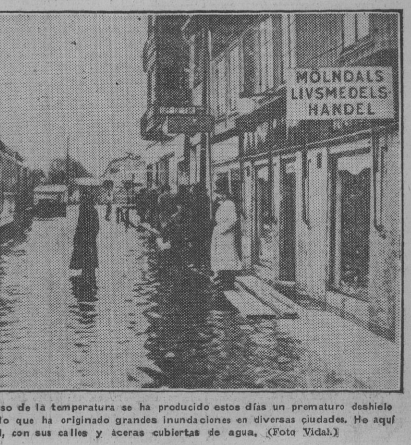
A causa de un repentino descenso de la temperatura se ha producido estos días un prematuro deshielo en la región meridional de Suecia, lo que ha originado grandes inundaciones en diversas ciudades. He aquí un aspecto de Moelndal, con sus calles y aceras cubiertas de agua.