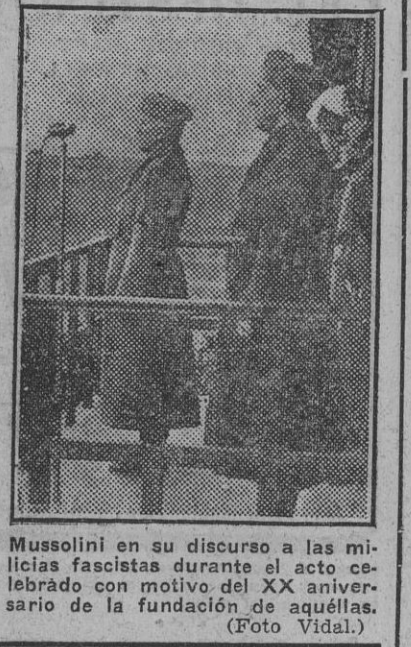
Mussolini en su discurso a las milicias fascistas durante el acto celebrado con motivo del XX aniversario de la fundación de aquéllas.