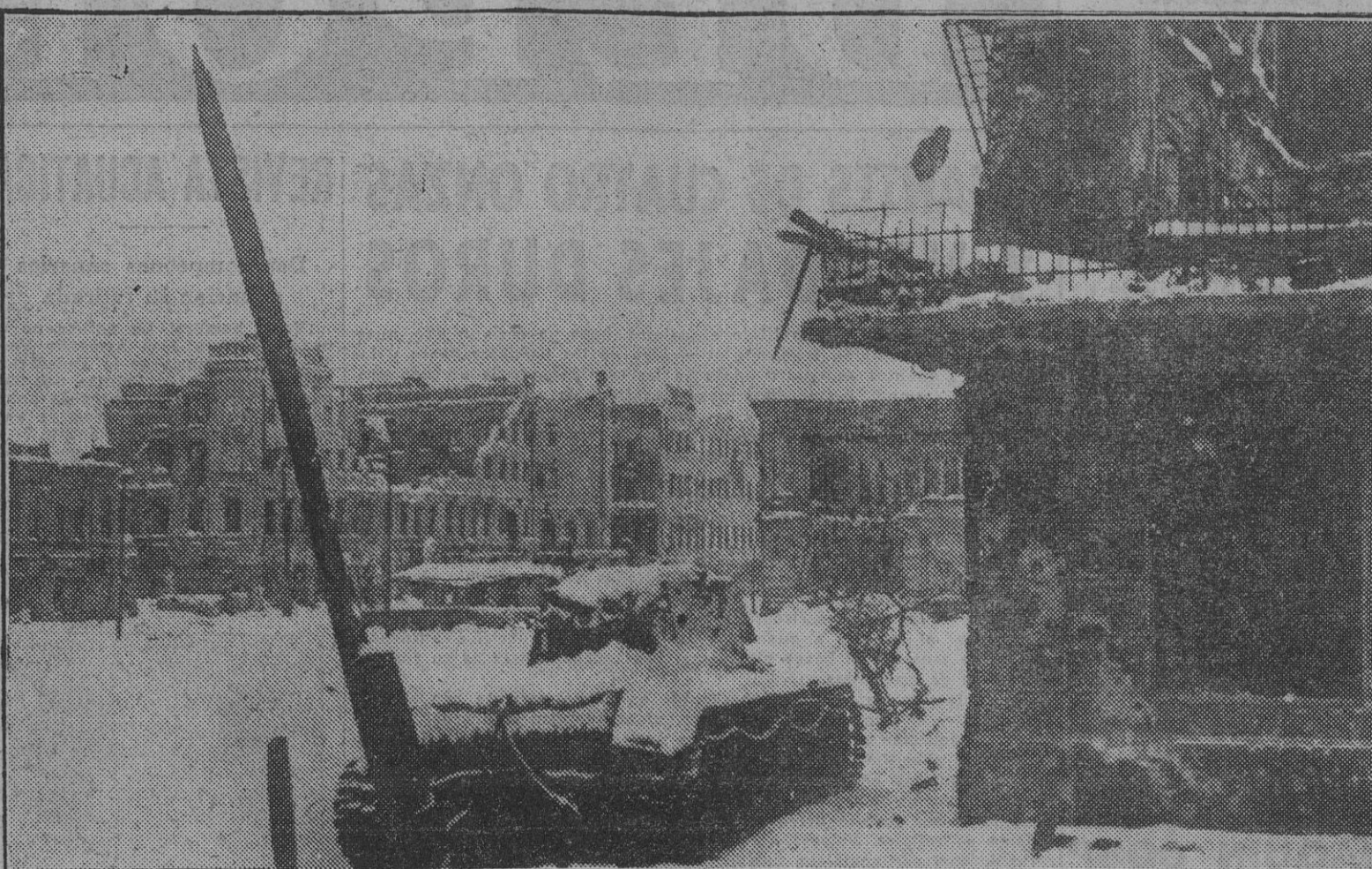
El recrudecimiento de los combates en Rusia da lugar a que la dureza de la lucha llegue a las ciudades, donde, al amparo de las edificaciones, el encarnizamiento cobra mayor fuerza. Aspecto de la plaza de una población después de reconquistarla a las fuerzas soviéticas.