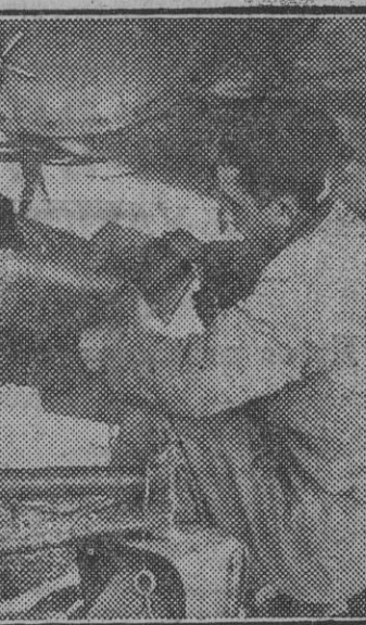
Soldados de la Aviación rumana cargando de bombas un aparato de combate listo para lanzarse sobre los objetivos soviéticos en el frente meridional de Rusia. Las fuerzas armadas de Rumania cooperan estrechamente con el Ejército del Reich en la lucha contra el bolchevismo.