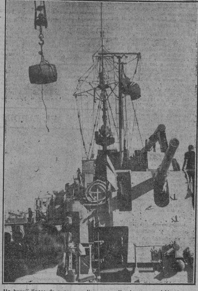
Un buque ligero de guerra se dispone a salir al mar en misión de servicio. Después de embarcar todos los pertrechos y abastecimientos, los tripulantes izan a bordo un barril de buen vino para festejar sus victorias.