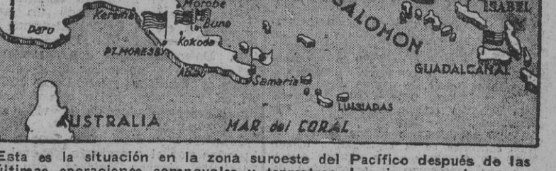
Esta es la situación en la zona suroeste del Pacífico después de las últimas operaciones aéreas y terrestres. Los japoneses han evacuado Guadalcanal y Buna, pero su aviación ha infligido una nueva y dura derrota a la Flota norteamericana al hundir 13 barcos y destruir 85 aviones en siete días alrededor de la isla Isabel.

TOKIO, 13. (S. E. T.)—El Cuartel General Imperial comunica: "Los resultados—no publicados hasta la fecha—obtenidos en la zona de las islas Salomón y de Nueva Guinea desde el 7 de agosto de 1942 hasta el 8 de febrero de 1943, son los siguientes: Pérdidas del enemigo: tres torpederos, cuatro submarinos y un barco de patrulla hundidos; cuatro submarinos, tres contratorpederos y patrullero averiados. Dieciséis torpederos y siete aviones derribados. Ocho mercaderes hundidos y dos averiados. Pérdidas japonesas: un crucero averiado, tres contratorpederos hundidos, tres submarinos hundidos y otros cuatro averiados, un patrullero hundido y otro averiado. Dieciséis aviones no han regresado o se han lanzado contra los objetivos enemigos. Además, 114 aviones han resultado gravemente averiados. Cinco mercaderes han sido hundidos y otros cinco averiados." (Efe.)