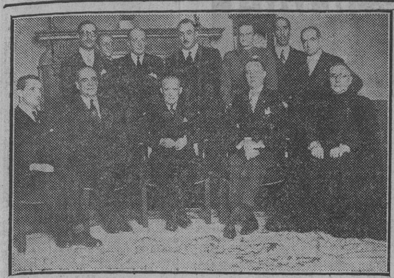
Personalidades que asistieron a la entrega del nombramiento de Hermandad Mayor de la Archicofradía del Apóstol Santiago al ministro de Asuntos Exteriores, conde de Jordana.

¡Tierra fértil para el trabajo y la sangre de los españoles!