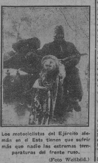
Los motociclistas del Ejército alemán en el Este tienen que sufrir más que nadie las extremas temperaturas del frente ruso.