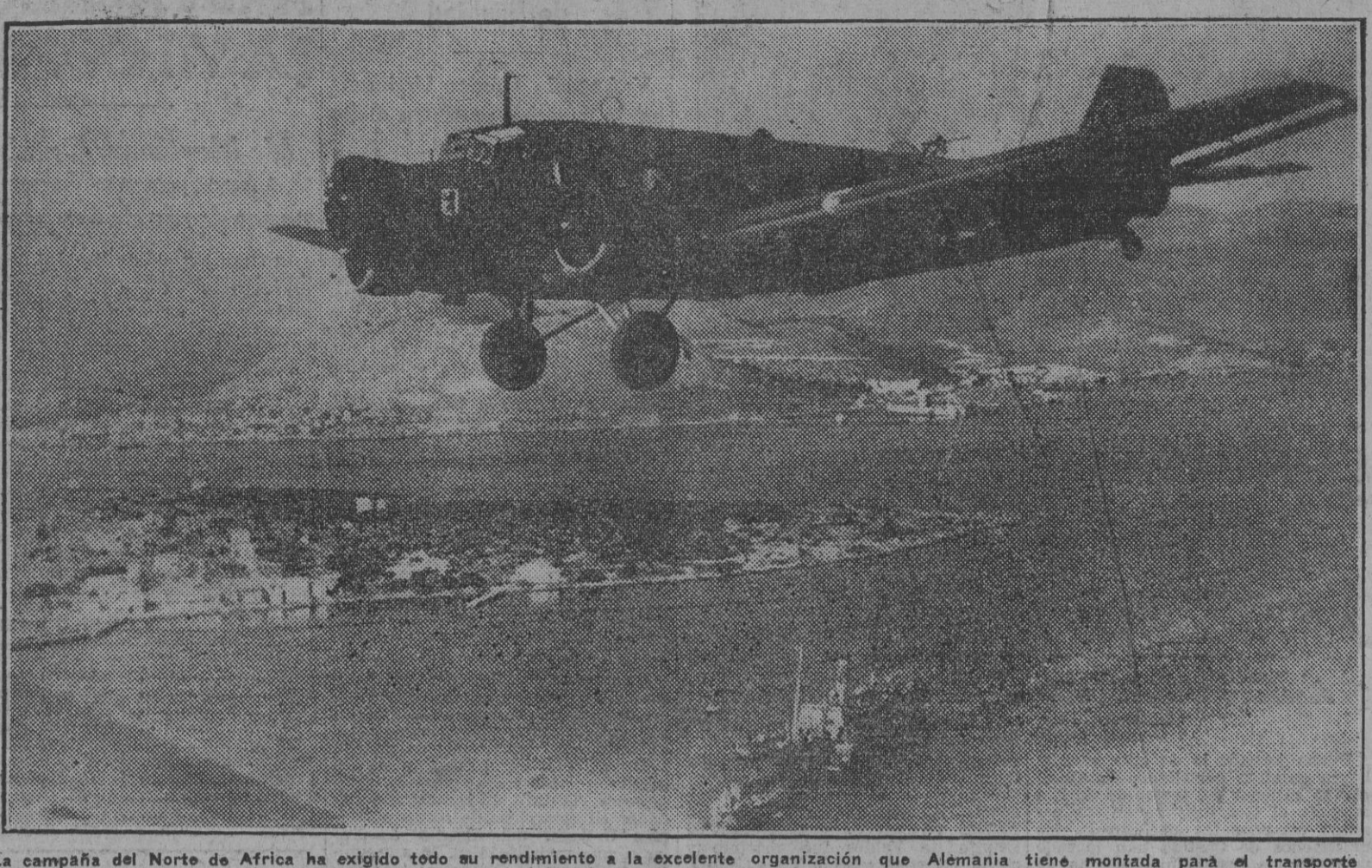
La campaña del Norte de Africa ha exigido todo su rendimiento a la excelente organización que Alemania tiene montada para el transporte aéreo. Los resultados han sido inmejorables, y nada ha entorpecido el abastecimiento completo que la ocasión exige. En la foto un "Ju 52" transportando tropas del Eje a los lugares de combate. (Foto Sánchez).