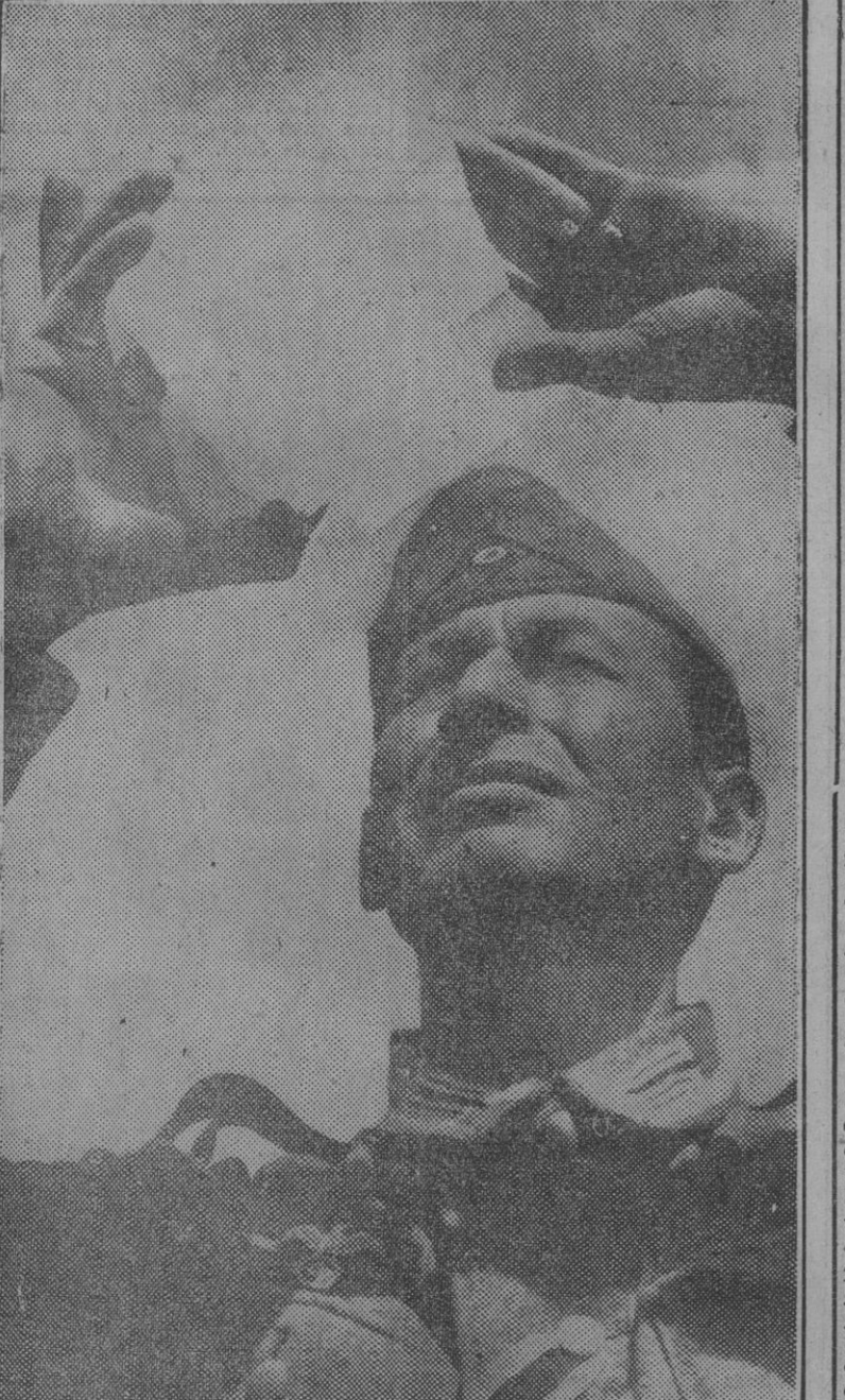
Un suboficial alemán examina un trozo de sal cristalizada de la región del Donetz, de la que se consigue la sal más fina.