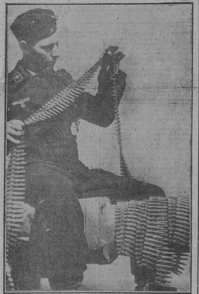
Antes de la partida del tanque alemán, uno de los tripulantes examina detenidamente las cintas de munición para la ametralladora, cerciorándose de su perfecto estado.