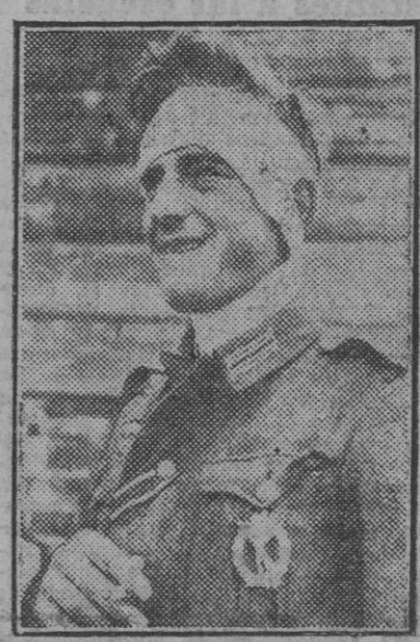
Un suboficial alemán de las fuerzas de choque herido en una acción heroica llevada a cabo en el frente del Este.