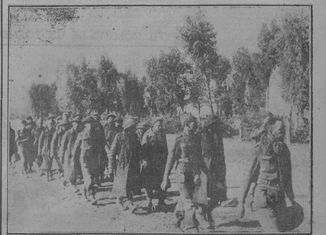
Las fuerzas del primer ejército británico, que ataca en Túnez, han sido rechazadas en varios puntos por las tropas del Eje. He aquí un grupo de prisioneros ingleses en marcha hacia un campo de concentración.