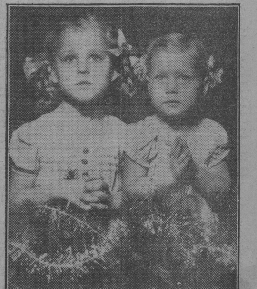
La expresión de estas dos niñas alemanas refleja claramente toda la emoción que les produce la grandiosidad de estas fiestas.