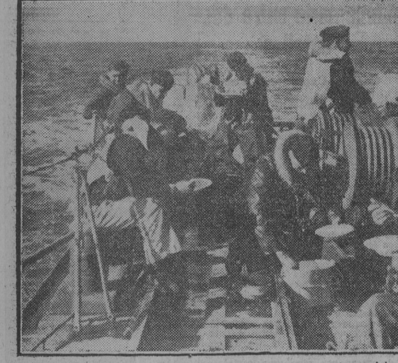
La hora de la comida en una lancha torpedera alemana, de servicio en el mar del Norte. (Foto Orús).

EL 1 DE ENERO será entronizado el Sagrado Corazón en el Ayuntamiento de Murcia MURCIA, 28.—El Sagrado Corazón de Jesús será entronizado en el salón de actos del Ayuntamiento el día primero de año. Por la mañana se celebrará en la Catedral una misa de comunión y bendición después la imagen por el vicario capitular de Murcia trasladada solemnemente al Ayuntamiento, con asistencia de autoridades y jerarquías. En representación de la ciudad, el alcalde recibirá el solemne acto de consagración. (Cifra).