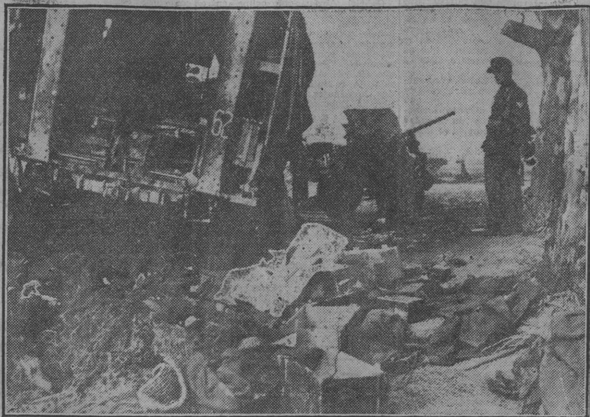
Las tropas del Eje han consolidado las posiciones últimamente ocupadas en Túnez y prosiguen su avance hacia la frontera de Argelia. Los combates registrados estos días han ocasionado nuevas pérdidas de material, como las que recoge esta fotografía.