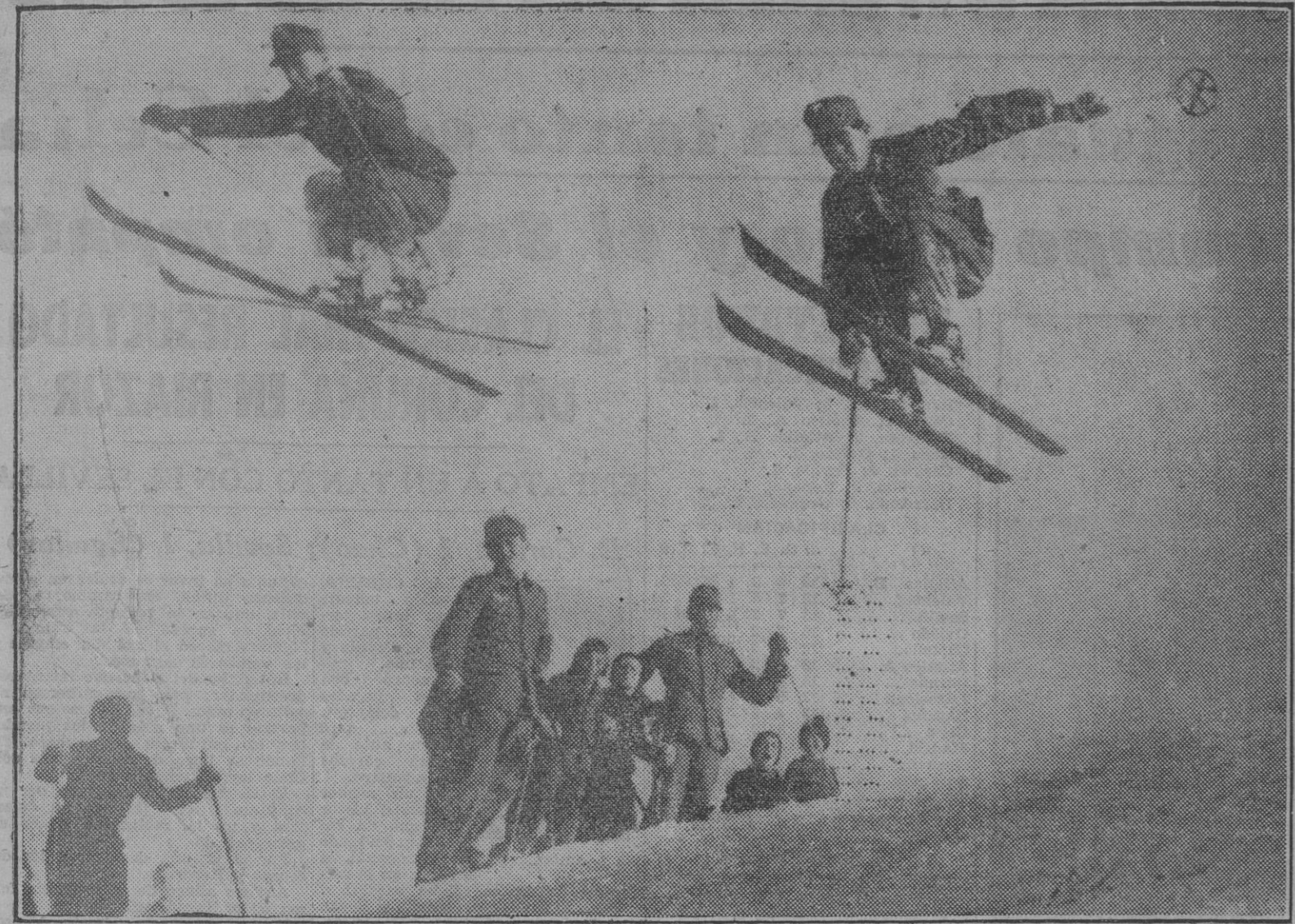
Dos soldados de las unidades alpinas del Ejército alemán ejecutan un doble salto con esquís ante la mirada crítica de sus compañeros y el gesto admirativo de los pequeños espectadores que han acudido a presenciar la exhibición.