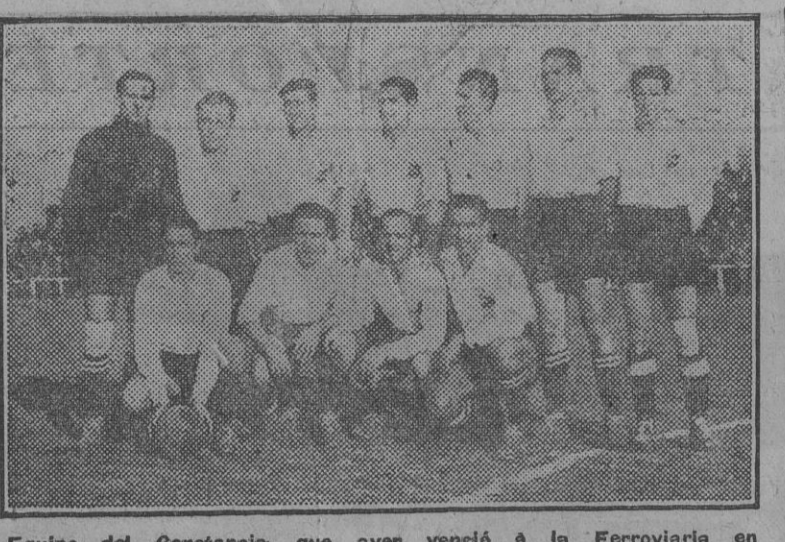
Equipo del Constancia, que ayer venció a la Ferroviaria en las Delicias.